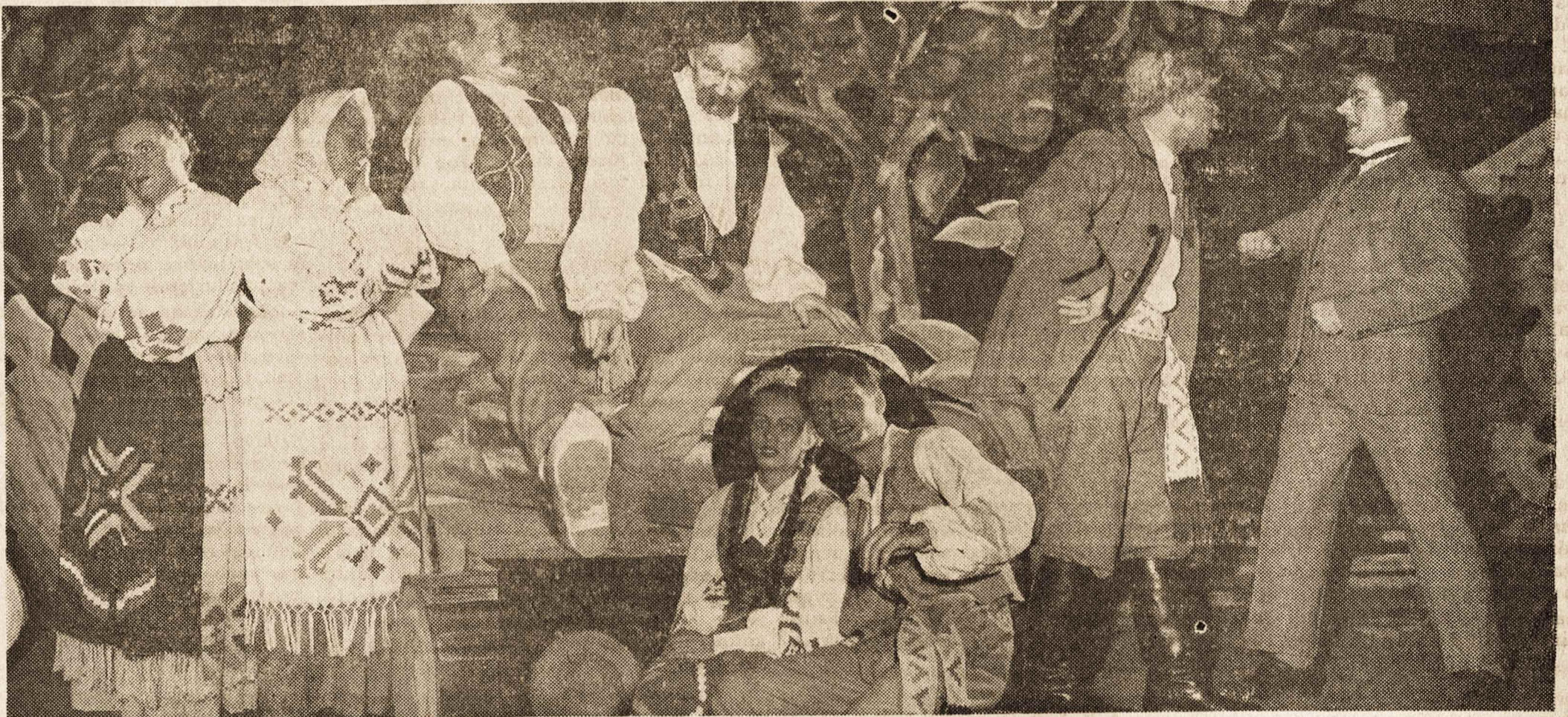
TAI „BUBULIO IR DUNDULIO“ VAIZDAI, KURIUOS LAPKRIČIO 25 DIENĄ, 5 VALANDA PO PIETŲ, TORONTO LIETUVIAI MATYTS UKRAINIEČIŲ SALEJE: 297 COLLEGE ST. ŠIS LINKSMAS NUTIKIMAS DIDŽIAUSIŲ PASISEKIMŲ PRAEJO MONTREALY, BE ABEJO JIS SUDOMINS IR TORONTO LIETUVIUS. JAŲ VAIZDAI RODO, KAD TAI TIKRAI ĮDOMUS DALYKAS. TAUTIEČIAI PRAŠOMI NESIVĖLINTI, NES LABAI SVARBU YRA VEIKALĄ MATYTI NUO PAT PRADŽIOS.