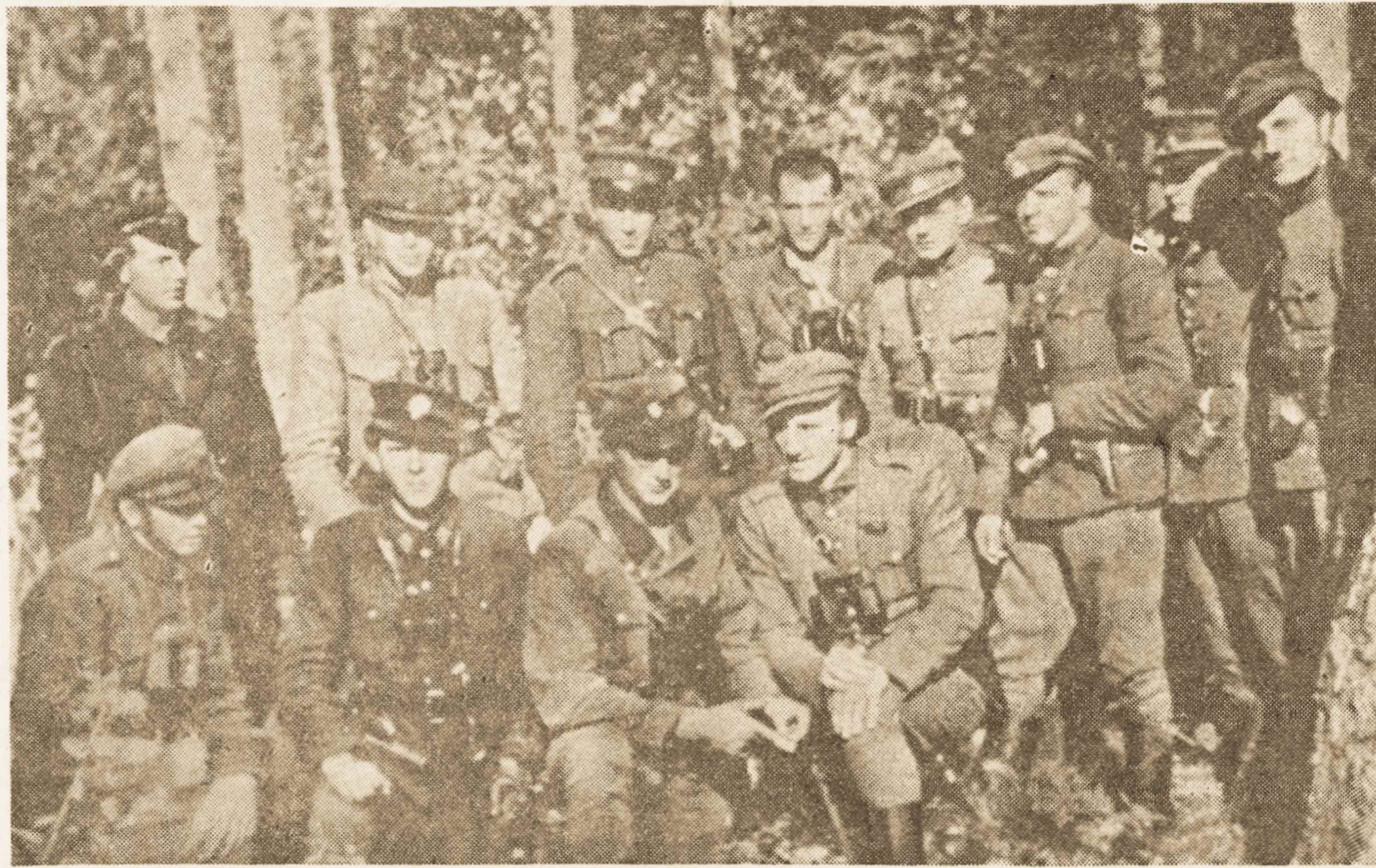
„PIRMASIS ILLUSTRUOTAS PRANEŠIMAS APIE LIETUVŲ PARTIZANUS“.

Dalyvauja ir V. Vok. premjeras Adenaueris. Prieš tai Londone tarėsi Prancūzijos ir Anglijos užs. reik. ministrai. Jų pasitarimai daugiausia sukosi apie pasipriešinimą agresijai.