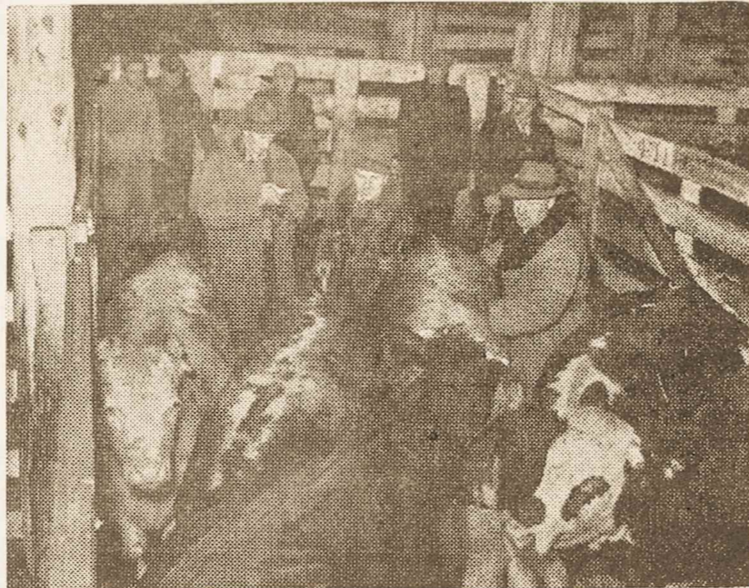
CBC nuolat informuoja ūkininkus apie paskutiniausias kainas gyvulių rinkoje. Atvaizde CBC komentatorius užsirašo paskutiniąsias kainų žinias.

Žemiau išvardintais atvejais pajamos nepridedamos prie bruto atlyginimo: kompensacija pagal Workmen's Compensation Act; bonai ir suteiktos do vanos; apmokymo kursui išeiti duoti priedai; diskontas duotas iš darbdavio įmonės perkant prekes; medicinos suteiktų pa tarnavimų vertė; nedarbingumo pensija, mokama vetera namams.