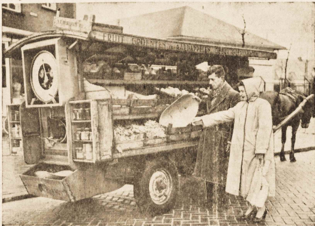
Nors Kanados miestai ir miesteliai pilni pilnų gėrybių, persipildyti krautuvų, bet čia patarnavimas žmonėms yra toks paslaugus, kad tiesiog į namus atveža visokios rūšies maistą. Atvaizde, paimtame iš Toronto „Telegraph“, matome didžiulį, arklio vežamą vežimą, kuriame prie kiekvieno namo durų šeimininkės gali pasirinkti visokių vaisių, daržovių ir tt.

Sekantiame NL numery bus skyriai: Mestas kaulas, del kurio riejamasi; Dar apie VLIKo atstovo paskyrimą; Pažiūrėkime, kas šiandien lietuvių tarpe darosi; Ką mums duoda vokiečių lietuvių bičiulių draugija? Magiškas žodis taktika ir kt.