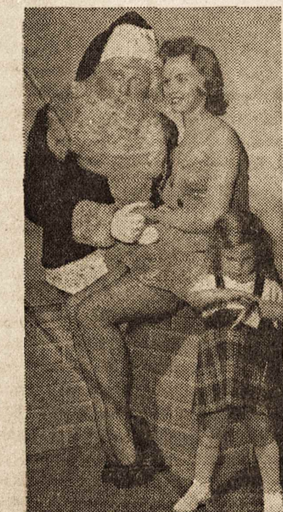
Taip Kalėdų senis — Santa Claus—sutiko naujuosius metus.

1) NL red. žiniomis, viename muzėjiniame rinkinyje, Montre alyje, yra A. Mickevičiaus ran ka užrašytų lietuvių liaudies dainų fotokopijos. Kas ypač sv arbu, lietuvių liaudies dainos, ne tiktai užrašytos pa ties A. Mickevičiaus ranka, bet yra jo paties ranka pažymėtas metravimas bei ištarimas, kas įrodo, kad jis lietuvių kalbą mo kėjo gana gerai.