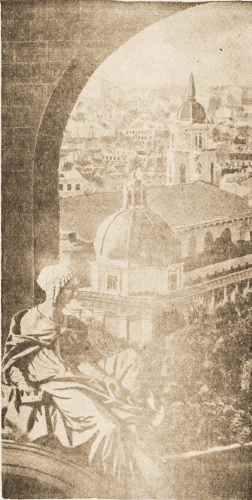
Gražusis Vilnius, kuriam bus uždrausta minėti Vasario 16