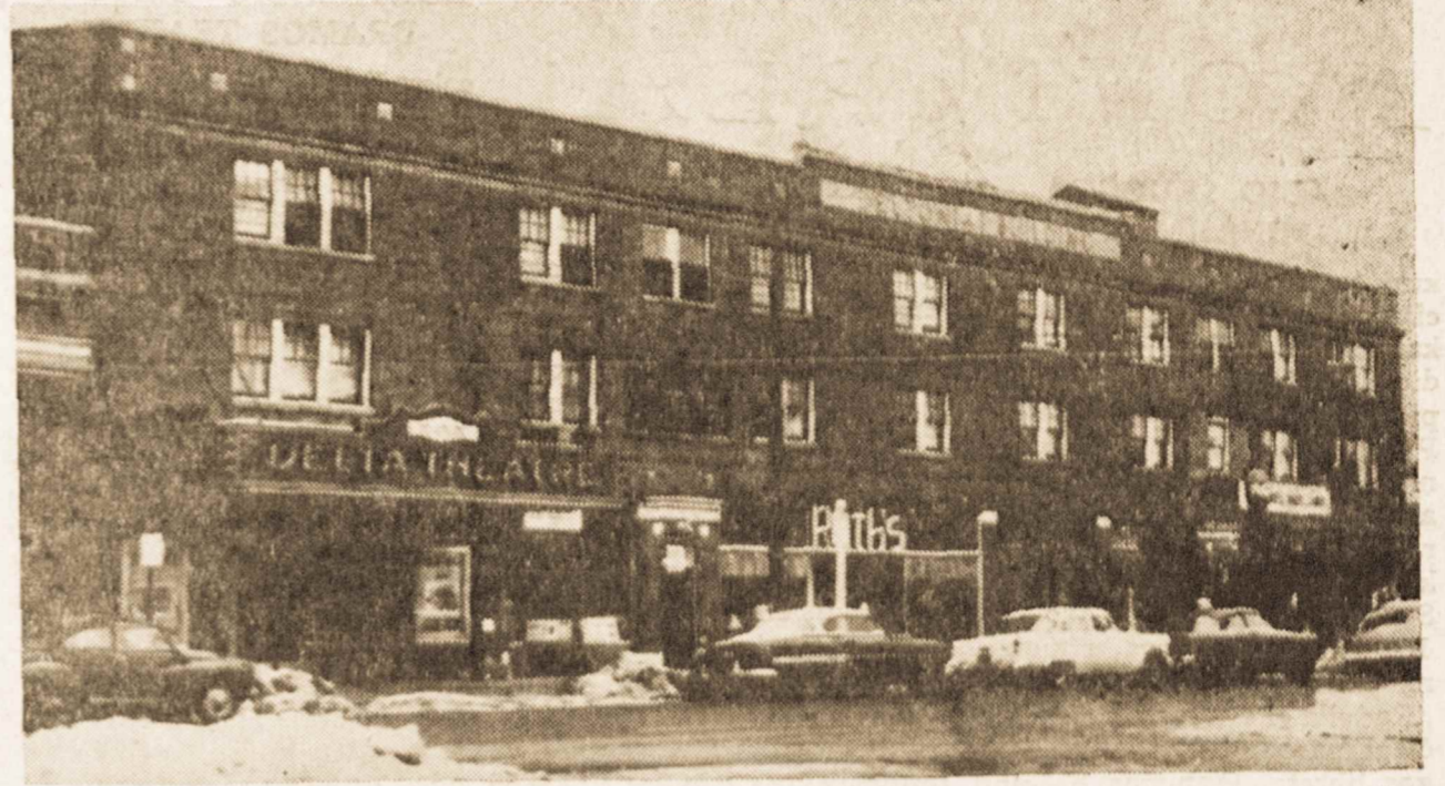
LIETUVIŲ NAMAI HAMILTONE IŠ KING GATVĖS — VAIZDAS ŽIŪRINTIŠ VAKARŲ PUSĖS.