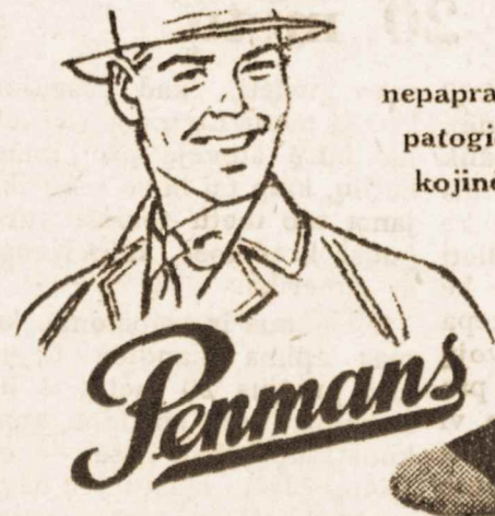
nepaprastai patogios kojines