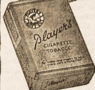
Garsiausias cigaretinis tabakas.