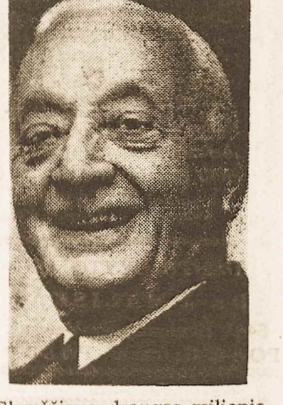
Chruščiovo draugas milionie rius Cyrus Eaton.