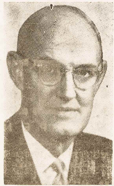
Profesorius D. C. Creighton,

iš Toronto Universiteto, žy mus Kanados istorikas, D. Bri tanijos ministro pirmininko Macmillano yra paskitras ko misitjon, kuri tyrinēs Centri nės Afrikos, šiaurės ir pietinės Rodezijos ir Nyasaland'o-Fe deracijos politinę padėtį. Ko misija, kuriai vadovauja bu vęs Britų kabineto ministeris, Viscount Moncton, susideda iš žymių ekspertų ir Common wealth'o santykių žinovų. CS.