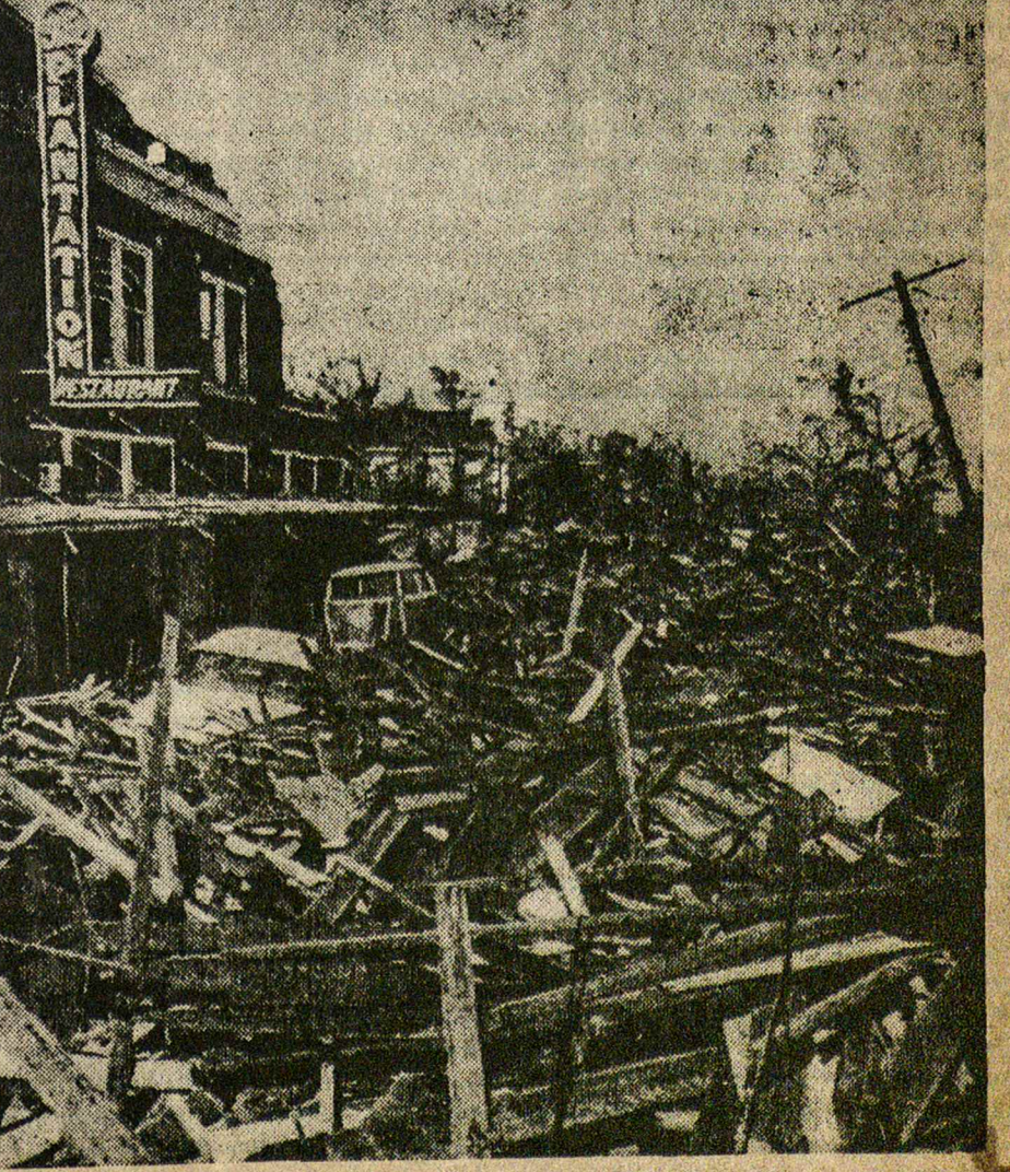
Uragano Camille sugriautas miesto kvartalas.