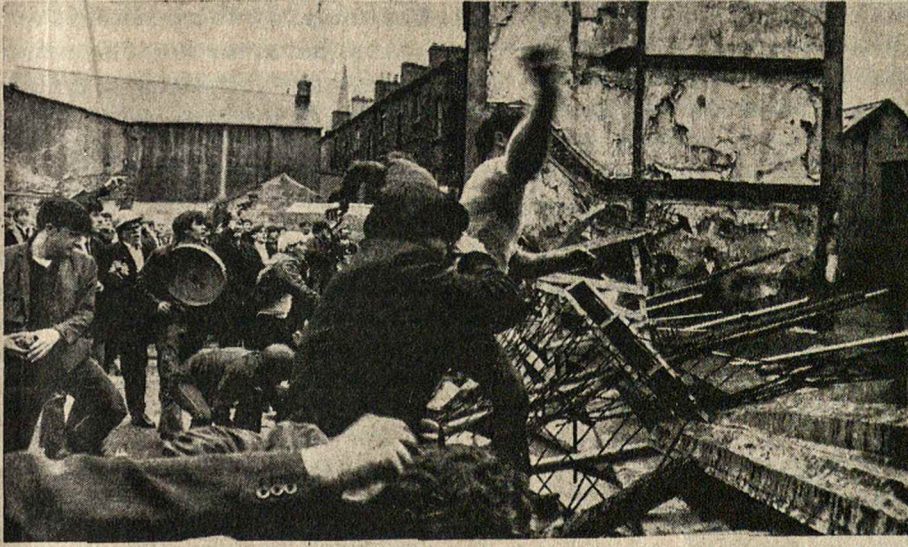
S. Airijos riaušių vaizdas.

širdis buvo organizmo nepriimta. Betgi jis taip pat užtikrino, jog tokios operacijos bus dar atliekamos, nes medicinos mokslas per pastaruosius metus esąs jau padaręs didelę pažangą, kovojant prieš organizmo tendenciją nepriimti svetimų organų.