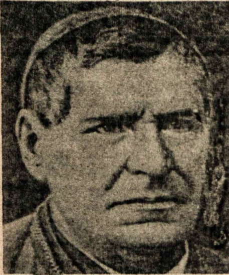
Vyskupas Motiejus Valančius (1801. II. 16 - 1875. V. 17)

Lietuviškai melstis, skatino be baimės viešai lietuviškai kalbėti.