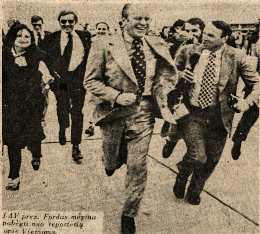
JAV prez. Fordas mėgina pabėgti nuo reporterių apie Vietnamą.