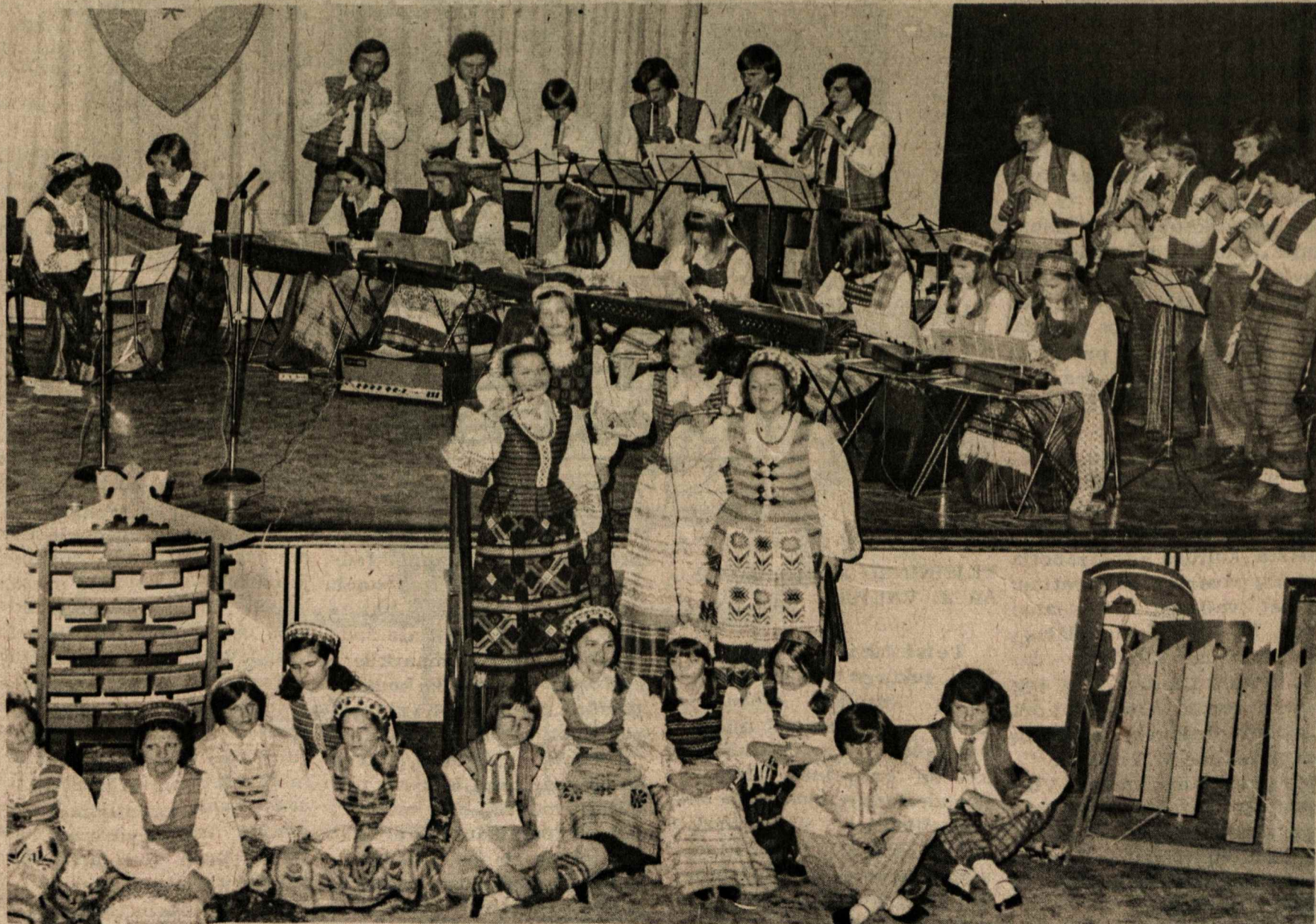
MONTREALIO LIETUVIŲ JAUNIMO ANSAMBLIS GINTARAS DALYVAUJA LIETUVIŲ DIENOSE

Robotas Viking 2 mechaniškais kasuvalais renka pa-