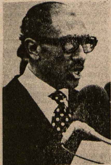
Egipto prezidentas Sadat

Gerilai reikalauja, kad vyriausybė paleistų 28 jų grupės narius iš kalėjimo, sakydami, kad šie yra politiniai kaliniai. Vyriausybė tačiau tvirtina, kad jie buvo nu-teisti už kriminalinius nusikaltimus ir jų paleidimas pažeistų krašto konstituciją.