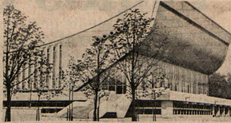
Naujieji Sporto Rūmai

Dar radome laiko užsukti į žuvų auginimo eksperimentinę stotį. Pastato vi-