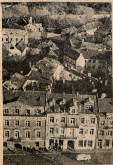
Senjojo Vilniaus kampelis

/ Papildomi įspūdžiai iš kelionės į Vilnų ir kitur / "O Vilniaus nepamiršk, lietuvi!" / tęsinys /