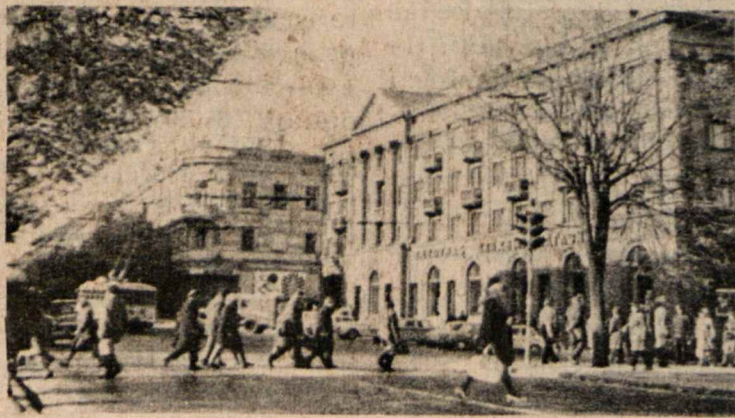
Vienas prospektų Vilniuje

Vieną vakarą mano krikšto dukra vėl prisiminė savo mamą ir savo sunkų vaikystės ir jaunystės gyvenimo kelią. Tais laikais apie savo tėvo gyvenvietę visai nieko nežinojusi. Praėjus keliems metams, patyrusi, kad tėvas jau turįs naują žmoną, jai pamotė. Tačiau savo pirmąją dukrą niekada nesirūpinęs. Todėl vaikystėje jai tekę gyventi įvairių giminaičių šeimose. Vaikystės gyvenimo kelias kartais buvęs labai sunkus: dažnai reikėję kęsti alkį ir šaltį. Niekada ir iš niekur nepatyrusi jokios užuojautos, paguodos nėra sulaukusi. Pradėjusi