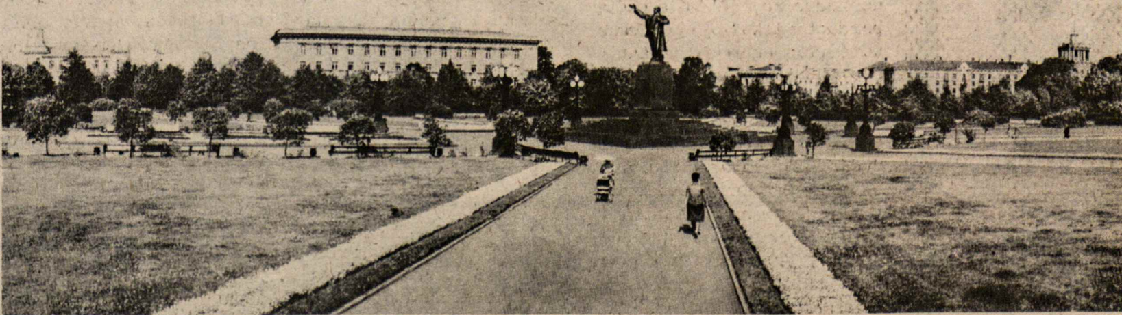
BUVUSI "LUKIŠKIŲ AIKŠTĖ", KUR MURAVJOV'O LAIKAIS BŪDAVO KARIAMI 1863 m. SUKILĖLIAI - LIETUVOS PATRIOTAI. DABAR TEN STOVI PRIMESTO LIETUVAI IR LIETUVIAMS IDEOLOGO LENINO PAMINKLAS.