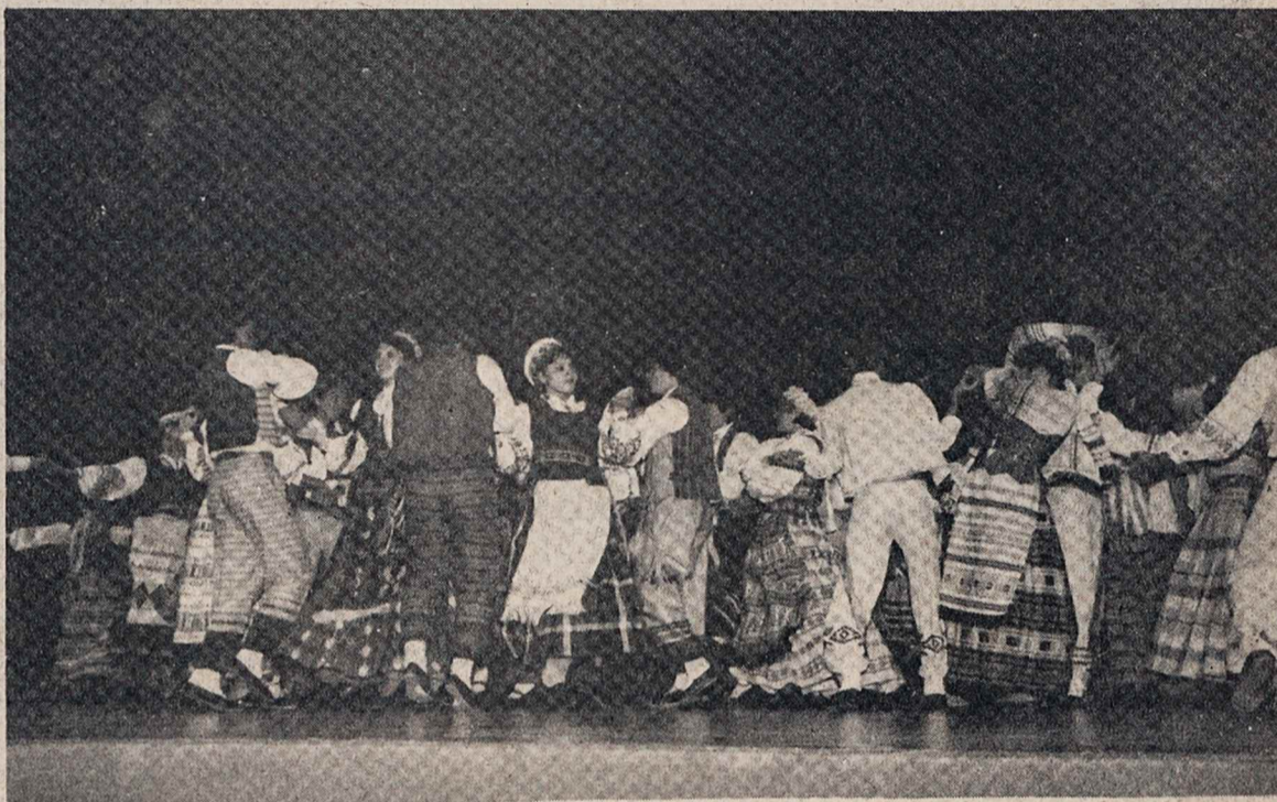
Sukasi, pinasi, sukasi