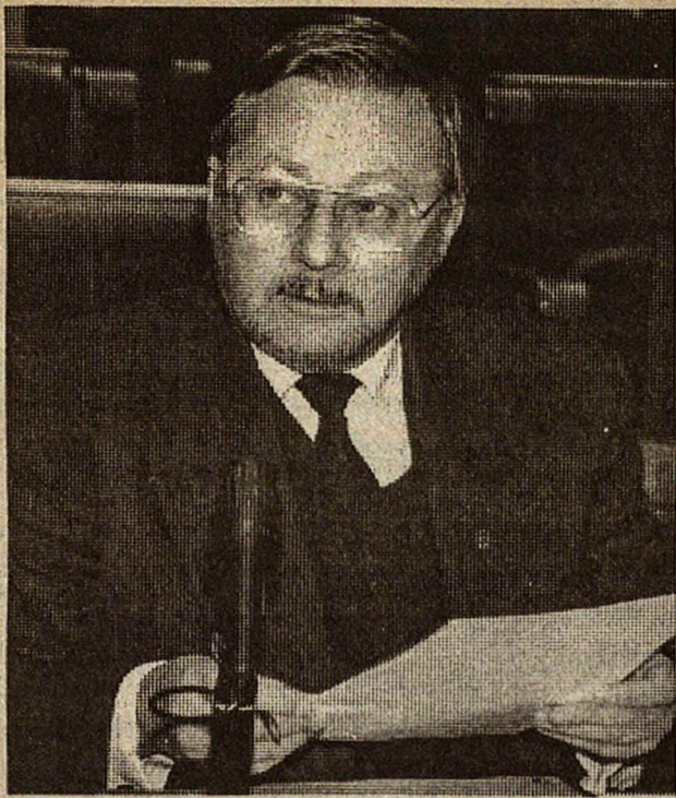
Prof. Vytautas Landsbergis