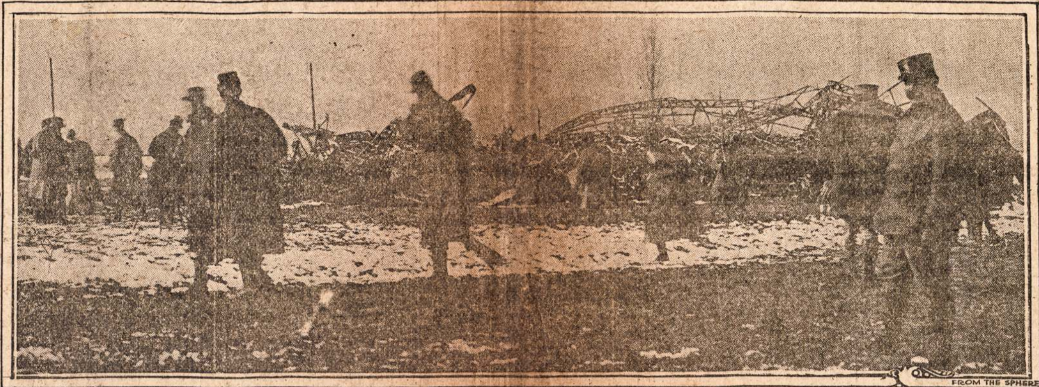
ZEPPELIN "L 77"

Paveiksias parodo sunaikinta Zeppelina "L 77" kuri pataike Francuzai arti Revigny. Balonas užs' dege nuo szuvio ir nupole, drauge su dvileka vokieciais kurie radosi balone. Tokie Zeppelinai daugiause užklumpa ant miestu, žudinda mi nekaltus gyventojus.