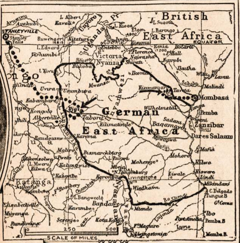
Generolas Jan. Smuts, angliszkos kariumenes rytinei Afrikai, kuris su savo narsiu pulku stengesi atimti paskutini szmota zemes nuo vokiecziu kaip ant zemlapiio matome. Anglikams prigialbsti Balgai ejnanti isz szalies Stanleyville ir jau uzeme aplinkina Ujiji (ku garsin gas keliuinkas Henry Stanley rado Dr. Livingstona). Anglikai uzejna uz Mombasa skaitliuje 25,000 vyru. Zenklelei **** parodo angliszka vaiska.