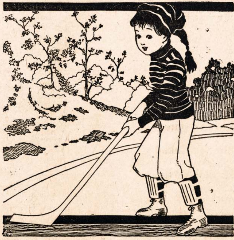
Mikutis losze su savo draugu kiaulute. Norints nematome jojo ant paveiklo bet czionais randasi jisiai.— Suraskite jin.