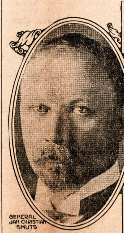
Generolas Jan. Smuts, angliszkos kariumenes rytinei Afrikai, kuris su savo narsiu pulku stengesi atimti paskutini szmota zemes nuo vokiecziu kaip ant zemlapiio matome.