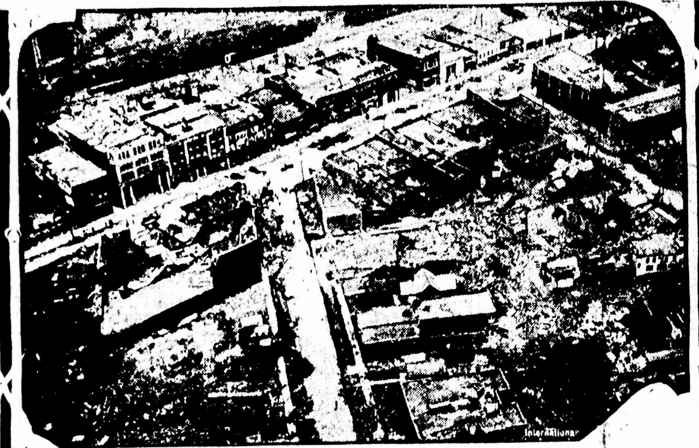
Sztai paveikslas nuimtas per areoplana isz miesto Lorain, Ohio, pro kuri prapute pasintiszka viesula padarydama milziniiskas bledes, užmusze ir suzeido daug žmoni.

Milijonierius nužude paczia ir pats save.