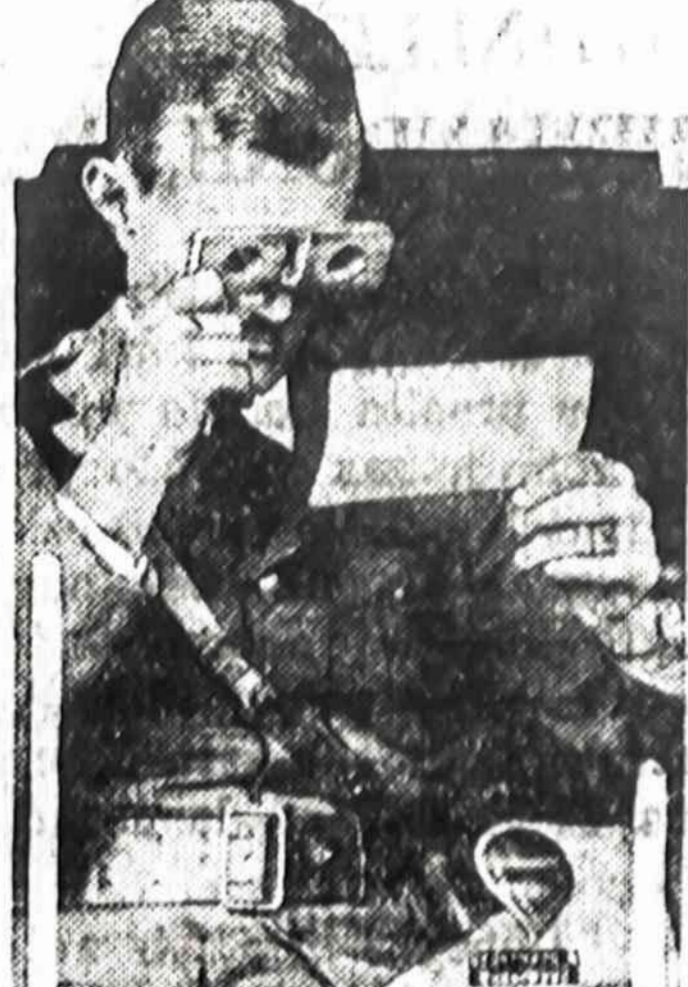
Lornetos del Kariumenes.

Net labai mažos ukas reikalauja dviejų vyrų. Vienam yra užtektinai darbo su arkliais, kitam važiuoti in miesta ir atlikti paprastus naminius darbus. Nekurie ukas darbai reikalauja dviejų vyrų, be tiek pagelbos negalima tinkamai prižiureti uke. Tipiszko Amerikoniszka uke turi užtektinai darbo vienam ukininkui ir dar