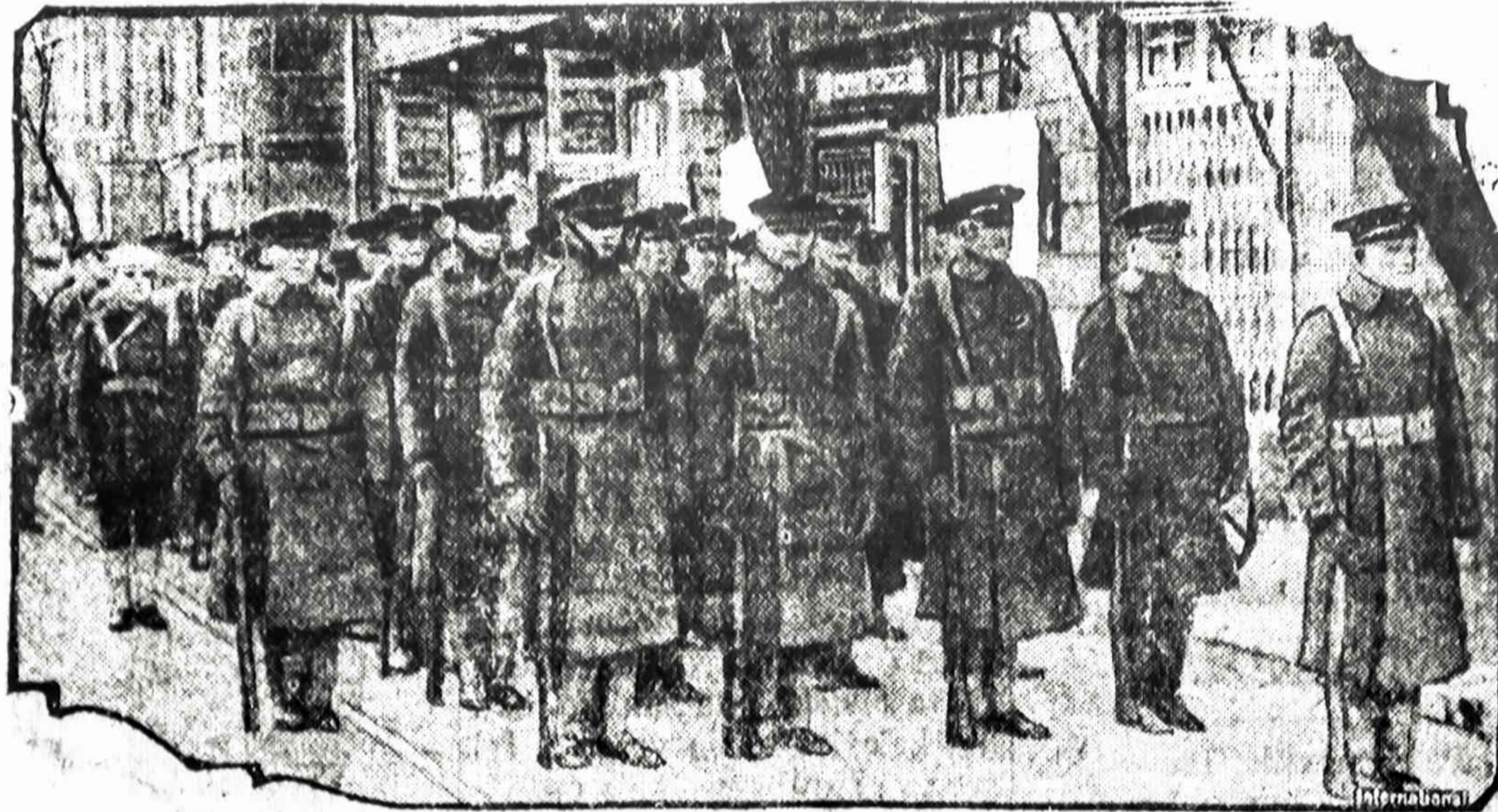
Sztai musu boisai-mariniai kareiviai (Marines) kurie sergsti Amerikonis ir juju loastes Shanghaij, dali miesto kuri yra apgyventa vien tik per Europiecius ir Amerikonus.