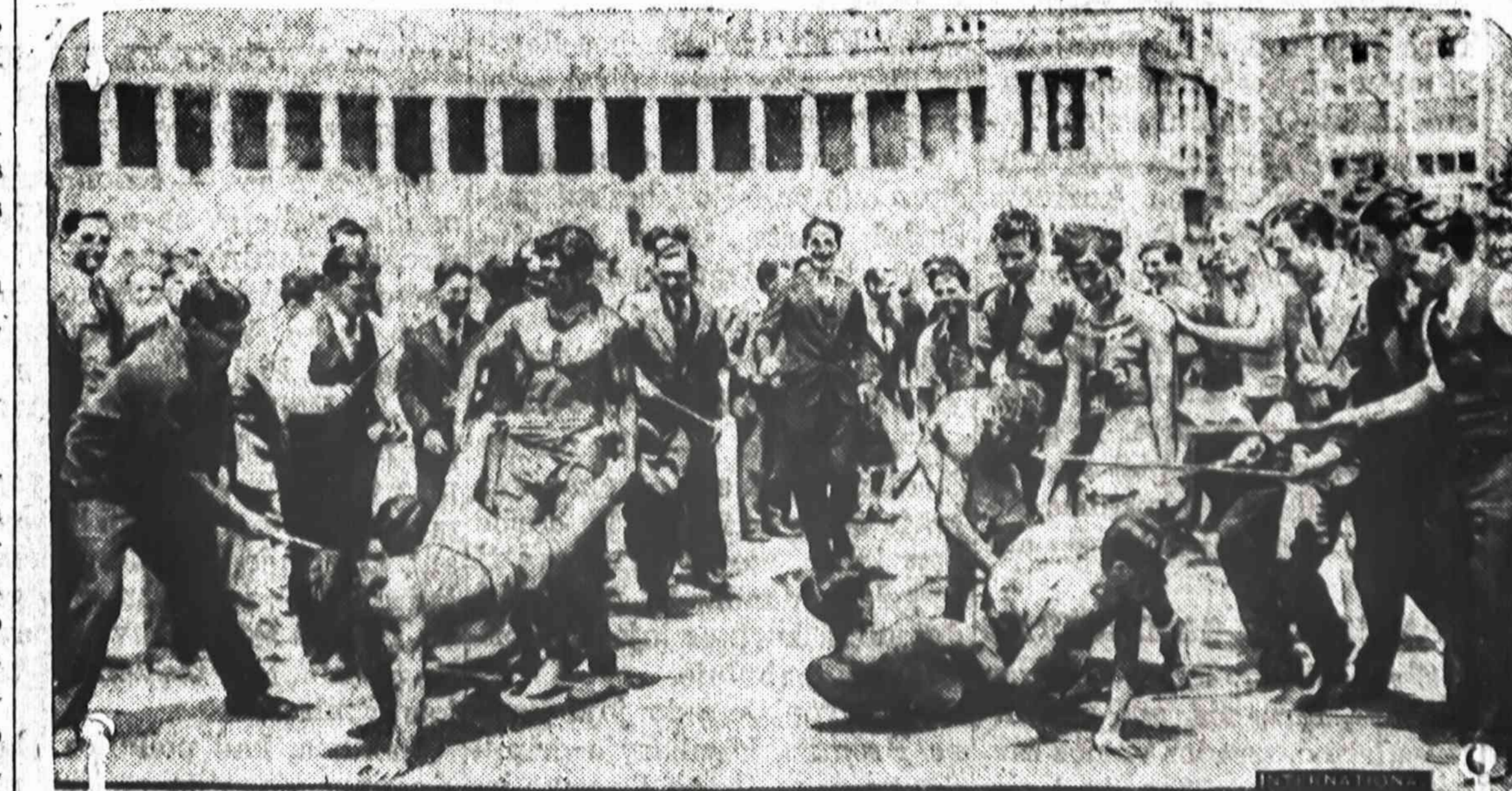
Žemesnio mokslo studentai (freshmen) City kolegijoje New Yorke buna "kankinami" per paskutinio meto studentus (sophomores), kuriuos privertineja perstatinet karukus ir kitokius szposus.