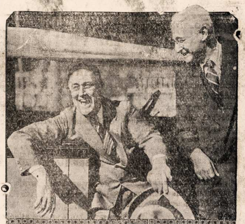
PASAKE JAM GERA JUOKA. Bernardas M. Baruch, kuris yra geru draugu naujai iszrinkto prezidento Rooseveltto, pasake jam juokinga istorijeje isz ko Rooseveltas szirdingai juokesi.

Dukte mano vienok likos prigauta per pikta dvasia, likos kunigaiksztiene, bet kaip in ezia gausis? O asz jai prigelbet negaluu.