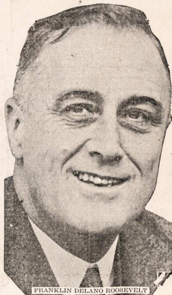
FRANKLIN DELANO ROOSEVELT

Kokis tai zmogus szove penkis kartus in Roosevelta bet nepataike. Majoras Chicagos miesto, Anton Cermak buvo paszautas kaipo ir viena motere ir valdiszkas detektivas