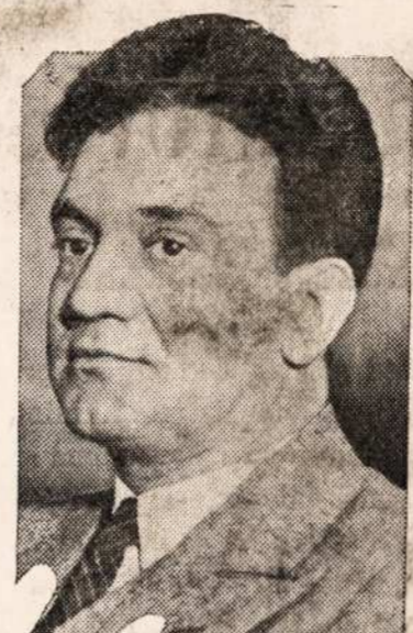
TYRINES BANKIERIU BIZNI.

SIENINIAI KALENDORIAI! Kas prisziuns 50c., aplaikys 2 Sieninius Kalendarius ant 1933 meto. W. D. Boczkaukas-Co., Mahanoy City, Pa.