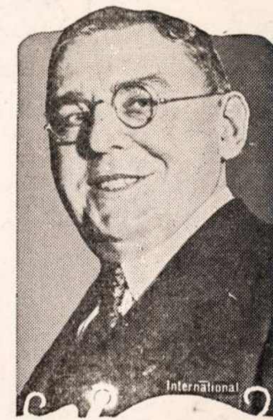
Anton Cermak, majoras Chica- gos miesto, kuris likos paszau- tas ir nugabentas in ligonbuti.