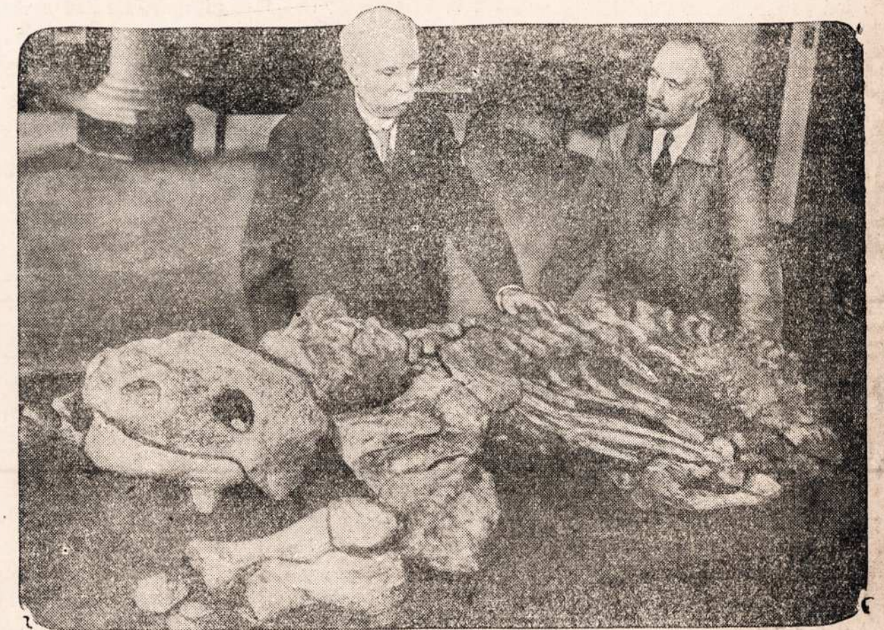
SZITA ŽVERIS GYVENO ANT SVIETO 75 MILIJONUS METU ADGAL.

Politikiszki kalininkai Vokietijoj yra ezionais laikomi per Hitleri kad jam nebutu bledingi ir vela nesutvertu karalystes. Tieji politikiszki kaliniai yra laikomi ant salos Havaj upeje. Tarp areztantu randasi daug žymiu žmoniū kurie likos nusiunsti in tenais per paliepima Hitlerio.