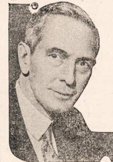
AMERIKONISZKAS SIUNTINIS IN ITALIJA.

Paveikslas parodo aplinkine kuri likos užlieta per vandeni tarp Holyoke ir Northampton. Tenaitiniai gyventojai aplaiko daug bledes ir keliolika szimtu gyventoju buvo priversti apleisti savo gyvenimus.