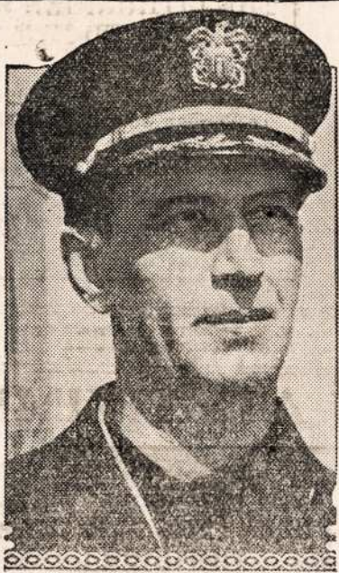
NAUJAS VIRSZININKAS LEKIOJIMO.