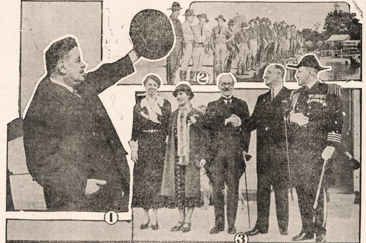
1—Eduard Herriot, buvusis Francuziszkas premieris, kuris atvažiavo in Amerika da- lyvauti ant ekonomiszkos posedžio ant užpraszyto per prezidenta Rooseveltą in Washingto- na. 2—Mississippi steitine milicija ant sargybos Humphrey paviete kur sergsti sienas upes kuria iszgrove tenaitiniai plantatoriai turedami tarp savos nesupratimus. Prieszininkai isz- draske su dinamitu sienas ir paleido vandeni ant savo prieszu farmu. 3—Vyriauses Ang- liszkas ministeris Ramsay MacDonald su savo dukteria atlanke prezidenta Rooseveltą.