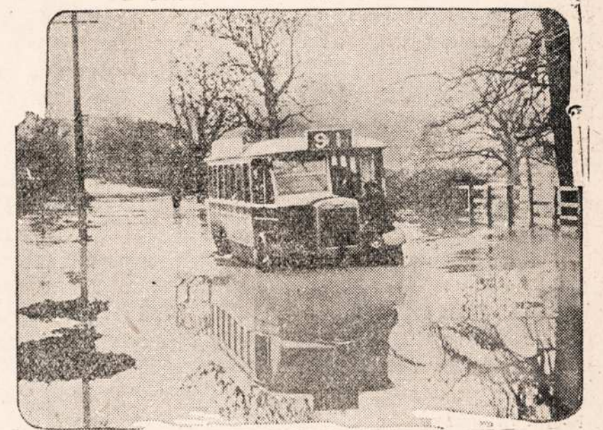
BOSAI VAŽIUOJA PER UŽLIETAS APLINKINES.

Breckenridge Long, gerai žinomas advokatas isz St. Louis, likos paženklintas per prezidento kaipo Amerikoniszkas siuntinis in Italija.