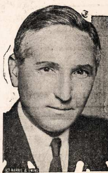
NAUJAS SIUNTINIS IN GRAIKIJA.

Tiejei paskutinei zodzei gas-padoriaus padare savo. Kalvis suprato kad per savo ilga liga buvo iszdaves daug pinigų ir turejo iszpildyt nora gaspado-riaus. Nuejo in sklepa atnesz-