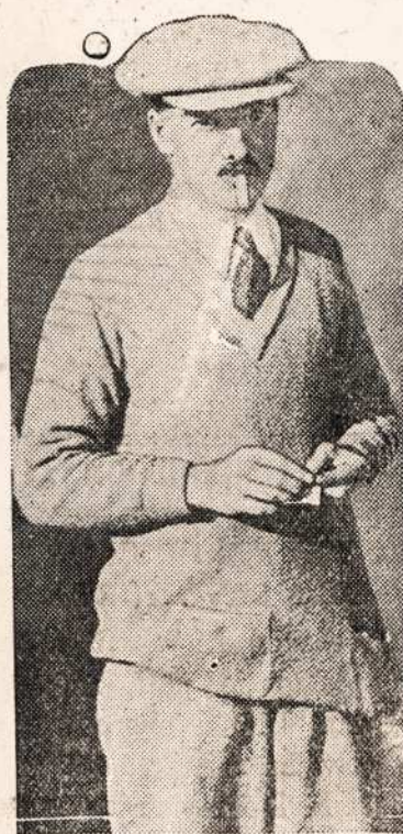
LAIMEJO GOLFO CZAMPIONATA.

1 kilometras (km) — 0.9374 varsto — 0.6214 Anglu mylios — 0.5391 juru mylios, arba mazgo. 1 varstas — 1.0668 km. — 0.6629 Angl. myl. — 0.5751 juru mazgu. 1 Angl. mylia — 1.6093 km. — 1.5086 v. — 0.8675 j. m. 1 juru mylia — 1.8551 km. — 1.7390 v. — 1.1527 j. m. 1 metras — 0.4061 arszino — 3.28089 pedos. 1 arszinas — 0.71119 m. — 2.33333 pedos. 1 peda — 0.30479 m. 0.42857 a.