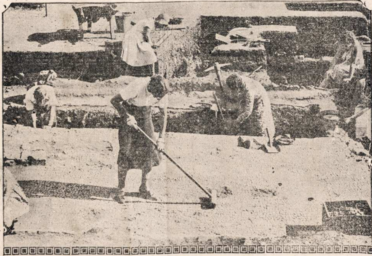
KOLEGIJOS STUDENTES ATKASINEJA SENOVES MIESTA.