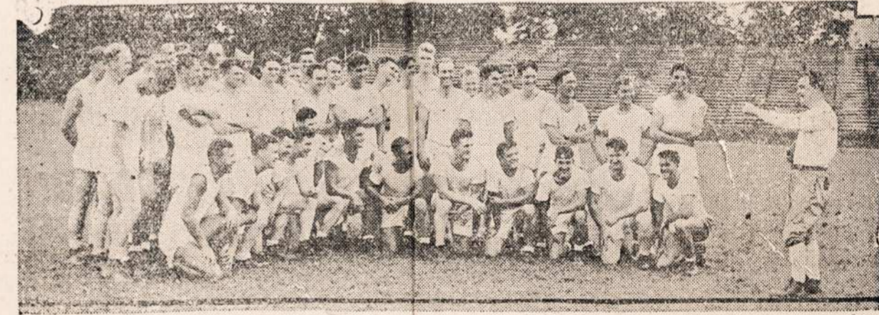
FUTBOLININKAI PRADEDA LAVINTIS ANT LOSZIMO.