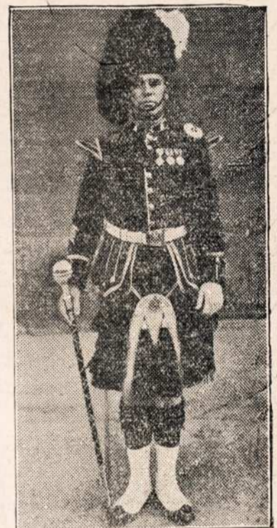
KANADISZKAS KAPELIJOS VADAS.