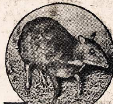
PELE-ELNIUKAS ISZ FILIPINU.

Tasai mažas elniukas kuris yra nedidesnis už pelę, ana die-na likos prisiumstas in Detroit-to žverineziu isz Filipinu Salu per Frana Murphy kuris kitados buvo majoru miesto De-troit, Mich. o dabar yra gene-raliszku gubernatorium ant tu-ju salu.