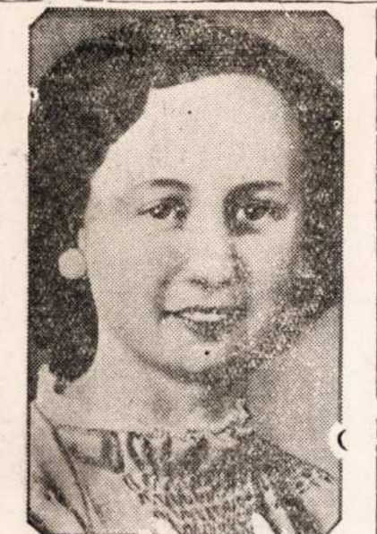
ATSIZYMEJO MOKSLE, AP-LAIKE DYKAI KELIONE IN EUROPA.

— Szeszi metai ir asztuoni menesai. Toliaus bus.