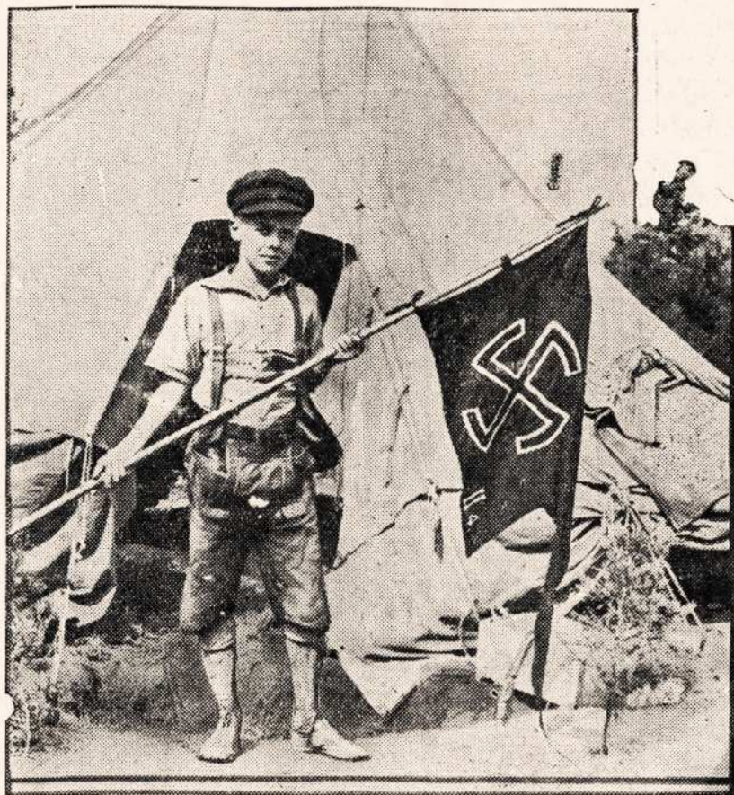
NAZIŲ SVASTIKINE VELIAVA NEW JERSEY.

♦ Japonija, pagal paskutini surasza gyventoju, turi apie 68 milijonus žmoniū.