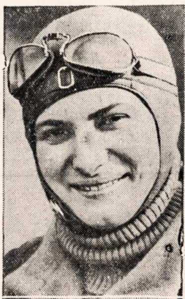
GREITA LEKIOTOJA EROPLANU.