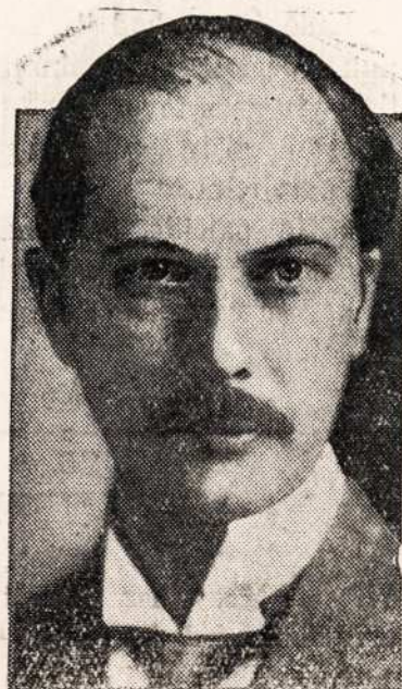
NAUJAS PIRMININKAS SVIETINES LYGOS.

Dekavodama Dievui už Jo geradejyste ir globa ant jos, prisirinko pilna žiursteli tuju sidabrinu žvaigždeliu. Buvo tai sidabrinei dolerei permainyti iz sidabrinu žvaigždeliu kuriu jai užteko lyg paskutinei dienai jos gyvenimo. —F.