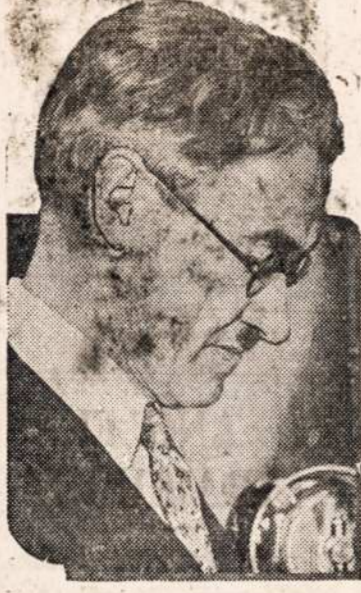
LIKOS ISZRINKTAS PIRMININKU.

Tasai prakeiktas užvydejimas — teisybia pasakius — tai motina visu kitu grieku ir prasizengimu. Užvydejamis isz-aukleja liežuvius, melagystes, apjuodinimus, paniekinimus ir užpuolinimus ant artimu, kurie tai griekai labai prasiplatino