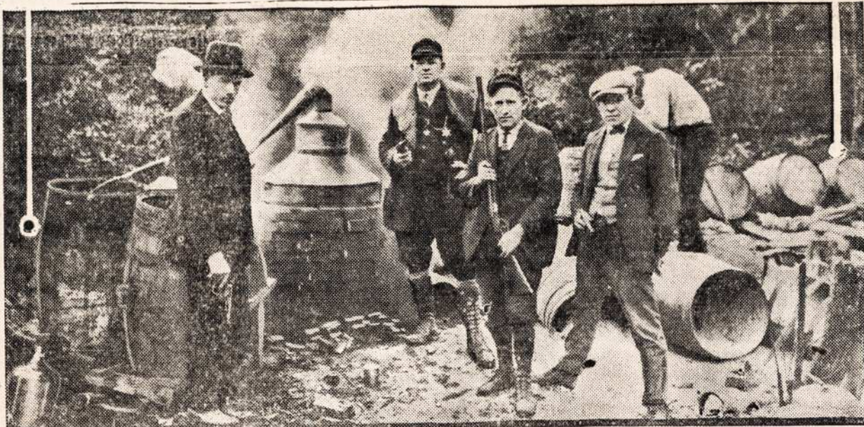
VALDZIOS AGENTAI SUDAUZE DAUG SAMOGONKU.

Llewellyn, Pa., — praeita Nedelios naktije, kilo ugnis hotelije National House, kuri padare bledes ant $15,000. Ugnagesei isz Minersvilles pribuvo in pagialba vietiniams gesyt liepsna. Visas hotelis isz triju