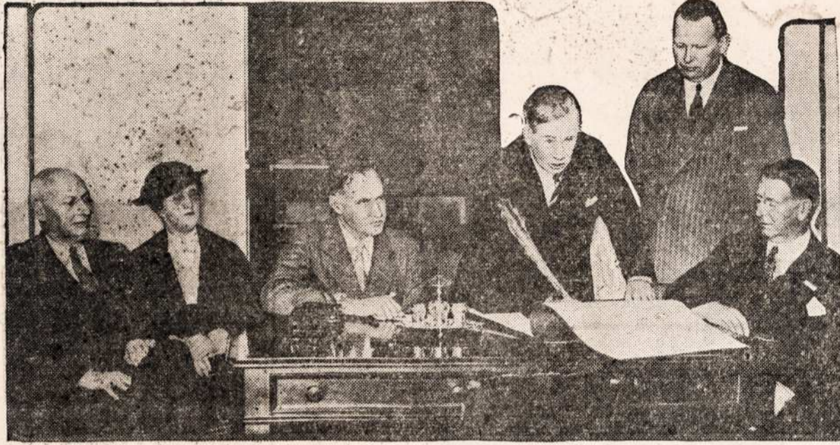
Ant susirinkimo žimunu, farmeriu, pramoninku ir kitu, kuris atsibuvo Dearborn, Mich., surasze neprigulminga laisve tikslu kad valdzia nesikiszu in ju biznius ir kad galetu varyti savo biznius svaiszkai o ne kaip valdzia jiems paliepia daryti.