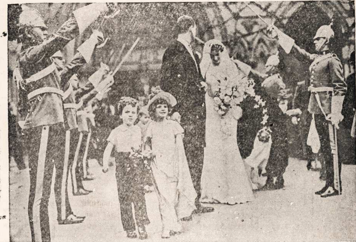
KARISZKOS VESTUVES ŽYMIOS POROS LONDONE.

Daugeliose dalyse New Yorke valdzia uždejo taip vadina-mas "patogumu stotis" kur per dirbines senas moteres ant pa-togiu motereliu kaip tai ant pav eiklo matome. Jeigu moterele tures už daug pilvelio tai ji sum ažys bet vargei isz tokios bobel-kos padarys puiku veideli.