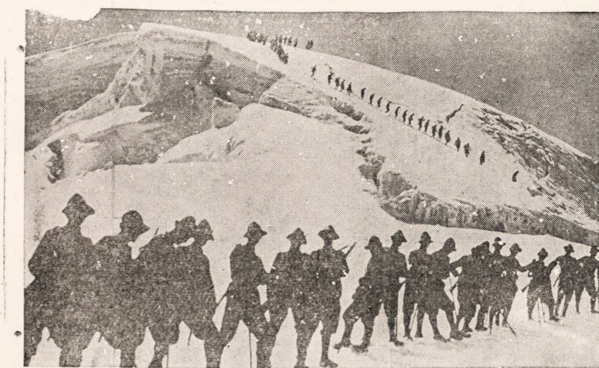
ITALISZKI KAREIVEI SERGSTI AUSTRIJOKISZKA RUBEZIU.