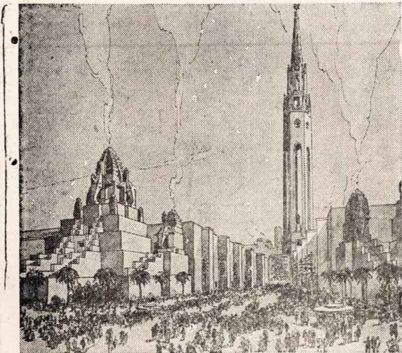
SAN FRANCISCO RENGESI ANT ISZKILMES.

— Matai poniute, turejau užtektinai darbo, pakol nu-czystinau tuos juodus klavi-zsius ant fortapijono. Puse isz ju buvo teip juodi, kad tu-rejau nemažai darbo, pakol juos nuczystinau!..