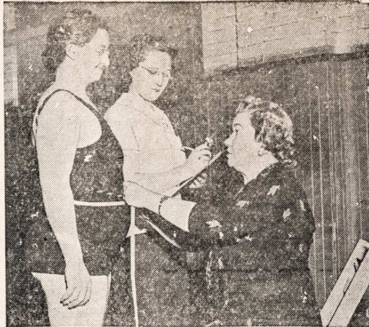
ISZ SZITOS BOBELKOS KETINA PADARYTI PATOGIA MOTERE.

— Vasario 20-ta diena, mu-su Lietuvei ne tik vietinei, bet ir isz visos apylinkes susirinko apvaikszezioti sukaktuves musti Nepriugulmingos Lietu-vos diena. Susirinkimas buvo Lietuviu Klube. Programas susidare isz muzikos, dainu, prakalbu, o vakare turejo dide-li bankieta. Didelis burys žmo-niu susirinko, o daugelis turejo stoveti laike programo. Viso miesto ir pavieto valdyba ir laike prakalbu linkejo Lietu-