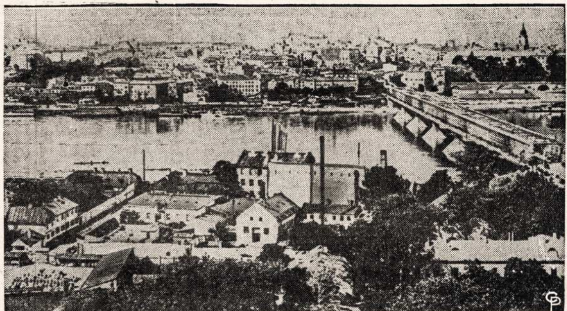
VARSZAVA DAUGIAUSIA NUKENTE PER BOMBARDAVIMA.