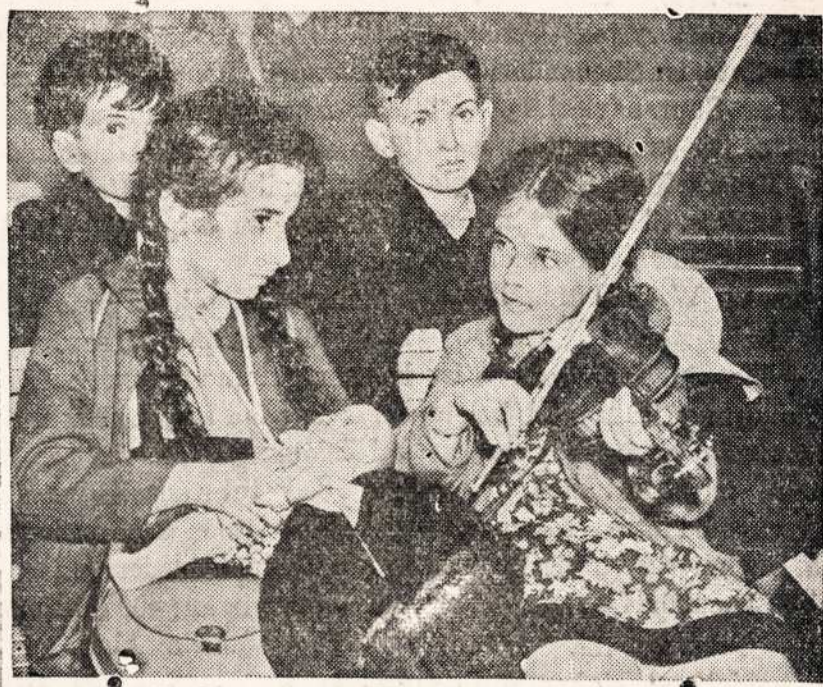
Kada ana diena pribuvo keli szimtai vaiku izz Vokietijos in Liverpoli, Londona, buvo la bai nusimine ir nulude. Viena mergaite geisdama palinksmint savo mažus draugus, pagrajino ant smuikos. Del tuju vargingu vaiku likos parupinta namai in kuruos likos patalpinti.

iszejo izz Pranuko pirkios ir nucejo pas Mitkalus. Tuojaus kaimas susijudino; vienas ir kitas izzbejo idant einancius užkabinti. Jie tuo tarpu kaip tai stebetinai juokesi: