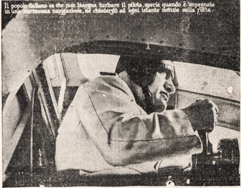
Idant parodyt savo zmoniems kad jis nebijo varyt erolana, Mussolini ana diena iszleke in padanges pats vienas. Isz savo keliones sugryzo pasekmingai.