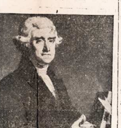
Prezidentas Thomas Jefferson

Prezidentas Andrius Johnson užmirszo apgarsyt diena Dekavones 1865 mete tadel atego pas ji dvasiszkieji jam apie tai primyt. Po tam jis apgarsino taja diena szvencsti 7 Decemberio.