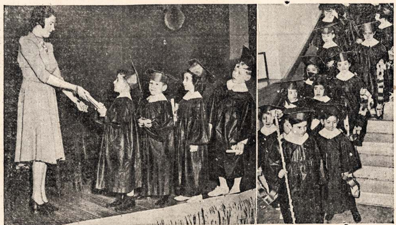
Sztitie vaikucezi, kurie užbaige mažū vaiku mokyklas, yra pasiredia kaip ir suaugu- sieji studentai kurie užbaigia augsztesni moksla. 17 mergaicziu ir 12 vaiku užbaige taji moksla New Yorke. Tosios mokyklos yra vadinamos ''Kindergarden Schools.''