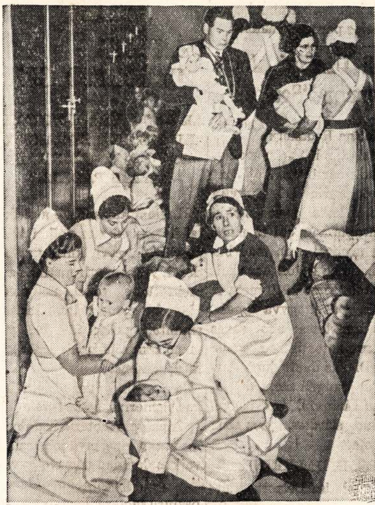
Viena isz Vokiszku bombu pataike in szita ligonbute kurioje radosi maži vaikai bet neuzmusze ne vieno. Veliaus ugnis kilo ligonbuteje bet greitai uzgesinta. Dažiuretojos apsaugoja vaikus nu o nelaimes.