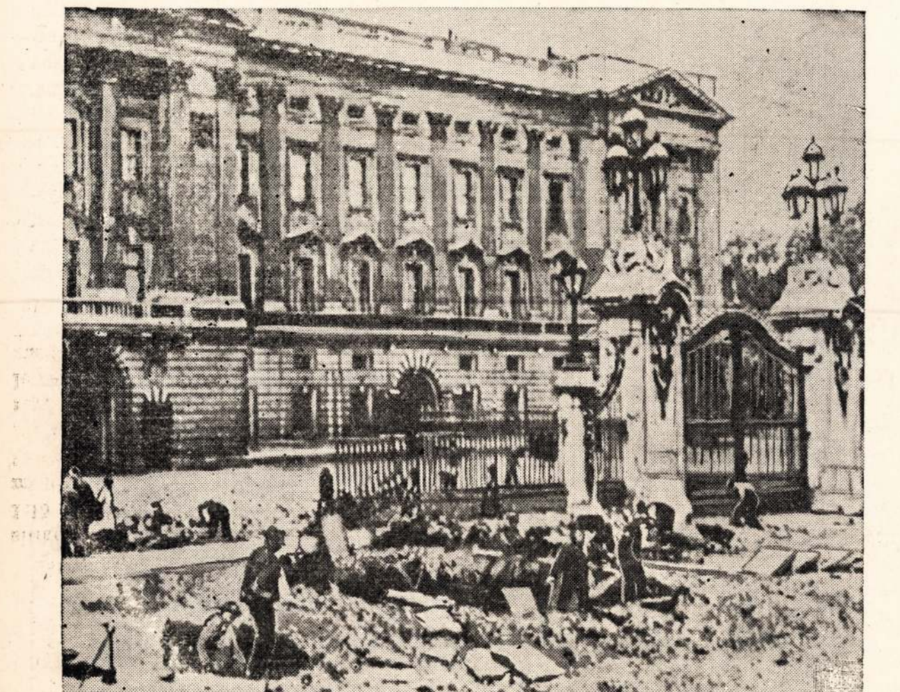
Sztai kaip iszrodo karaliszkas palocius Buckingham Palace kada Vokiszka bomba eksplodavojo priesz ji padarydama didele skyle. Bomba truko apie 24 valandas po numetimui jos priesz palociu. Karaliaus su paczia tame laike nesirado namie.