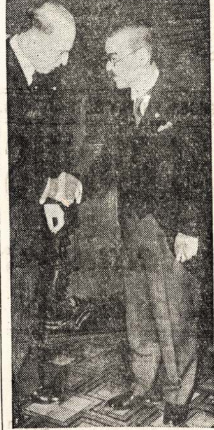
Heinrich Starmer, specializskas Vokietijos pasiuntinys in Japonija, turejo svarbu posedi su Japoniszku uzrubeziniu pasiuntiniu, Yurube Matsuo, po padarymui svarbios sutarties su Japonija.