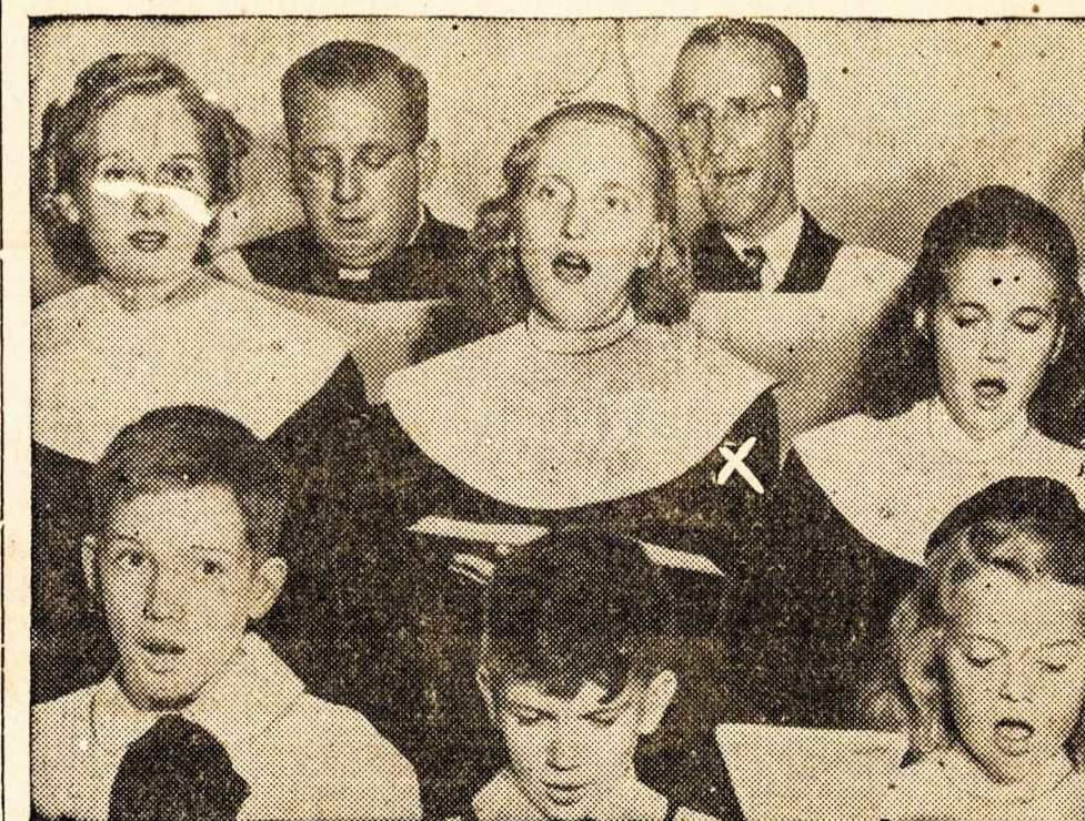
Margaret Truman, Prezidento dukte gieda ant choro Episkopalu baznyczioje. Szitas choras giedoja per radijo isz Independence, Mo. Ji ir keliose operose yra giedojusi.