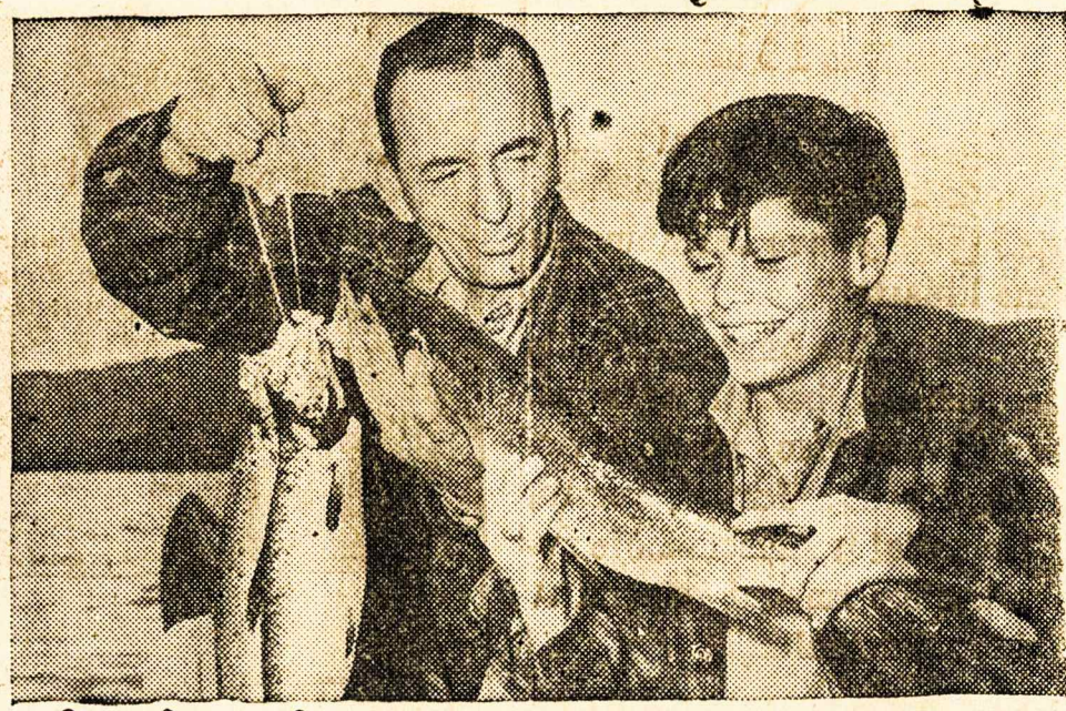
Tevas ir sunus džiaugiasi kad taip gerai pasiseke tiek daug žuvu pagauti. Maine valstijoje yra daug geru ežerų, kur galima per isztisus metus kasdien žuvauti ir pagauti tokiu žuvu kaip czia matote. Czia ir medziokle gera. Daug žmonių vaziuoja in Maine valstija žuvauti ar medzioti.

Ausztant asz nubudau. Laikrodis rode puse penktos, kuomet asz paszokau: visai nubudau ir buvo intemptas kiekvienas mani nervas. Tai buvo kažkoks garsas, paskui kažkoks ezerszkimas ir galu gale žmogaus riksmas, kuris da tebeskambejo mano ausyse. Sedejau ir klausiausi, bet aplink buvo ramu. Negalejo sapne man pasigirsti tasai riksmas, nes jo atgarsis da tebeskambo kažkur visai arti manes. Asz paszokau isz lovos, ir užsimetes ruba, iszejau kajuten. Isz karto asz nepastebejau tenai nieko nepaprasto. Prieblandoje vos matesi raudonu dengtas stalas, szeszetas kedziu ant rateliu, spintotos kabas borometras ir galu gale, margoji deže.