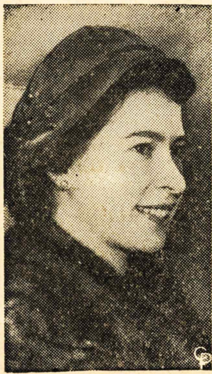
Anglijos Karaliene Elzbieta Antroji

Jiedu pirmiausia aplankys Kanada ir paskui eroplanu nu-