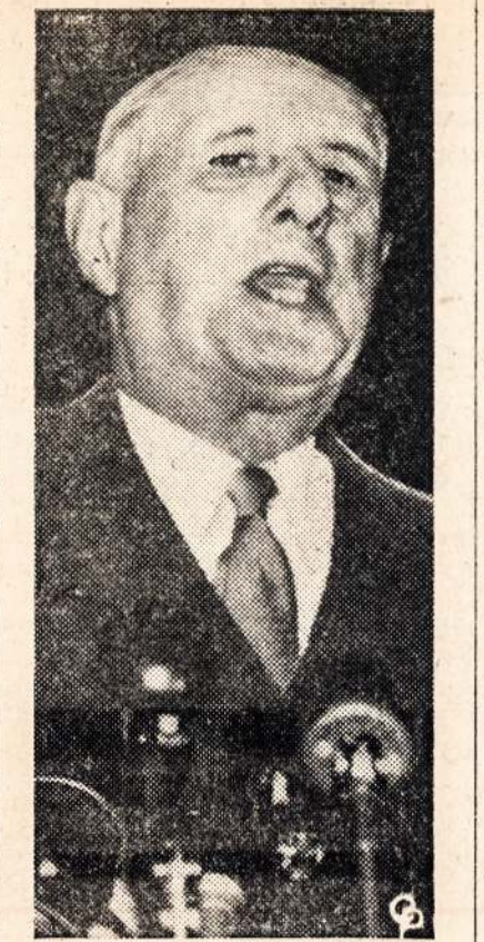
Generolas Charles de Gaulle

Visi Prancuzai teipgi gerai žino, kad kai tik Generalas Charles de Gaulle uzimtu valdzia, tai sukilimas Alžirijoje ta paczia anda dingtu, nes ta sukilimo anda Gen. Charles de Gaulle prola ir intakingi kariniai. Generolas Charles de Gaulle yra niszkaiai pasakes, kad jeigu