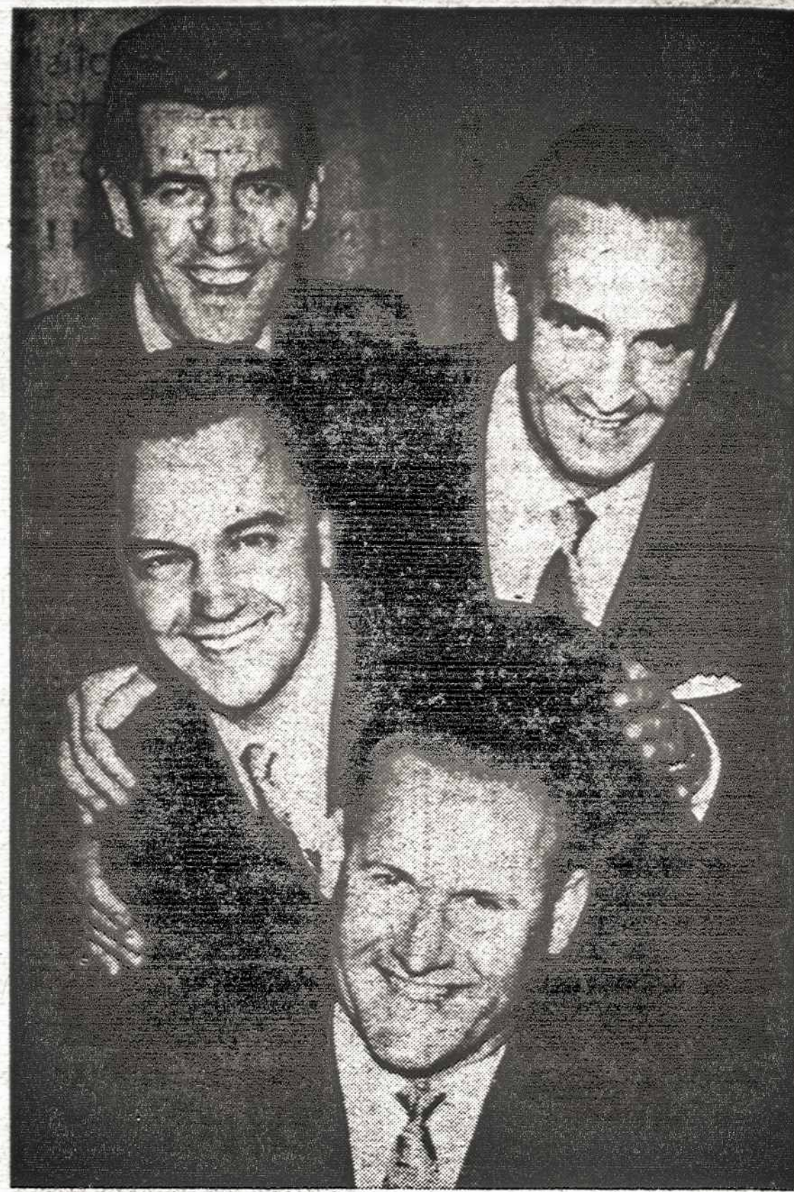
Toronto vyru kvartetas vėdinamas muz. St. Gailevičiaus, išplis programa "Varpo" septynmečio baluje, lapkričio 7 d. Pilskėlimo parapijos salėje.

Varšuva. — Lenkijoje veikia iš užsienių prisijusių vaistų supirkimo punktai paskelbė, kad nuo lapkričio 15 d. nebesupirkinės net 260 vaistų rūšių.