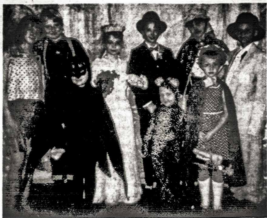
Hamiltono ateitininkų sendraugių rengtame vaikų kaukių baliuje...