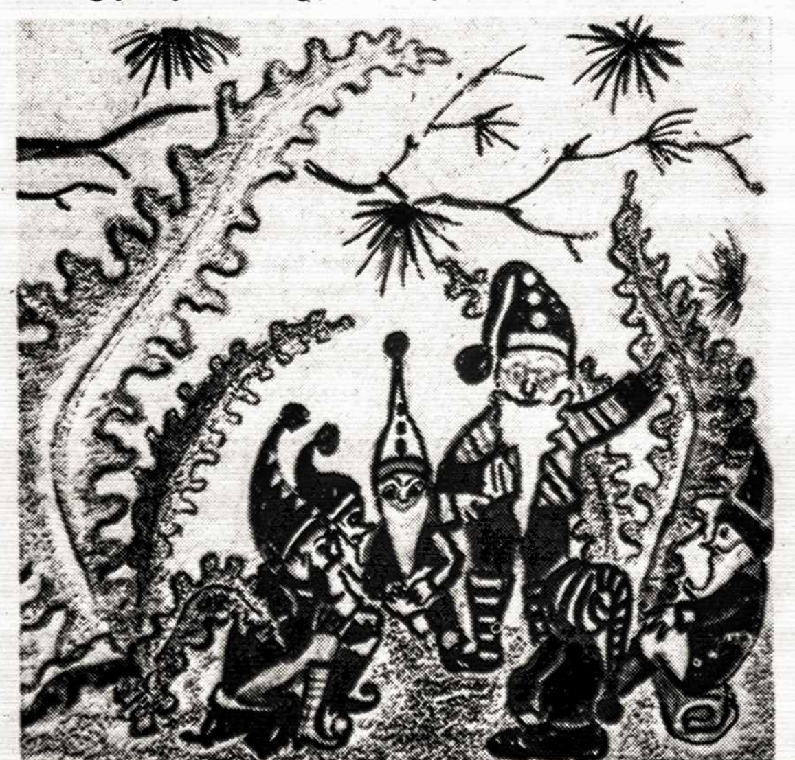
Taip atrodo nykštukų mokykla. Ilustracija Reginos Ramanaitės

Pagalvokite, gal kas iš vaikūčių gali atsakyti į tuos nykštukų mokyklos klausimus?