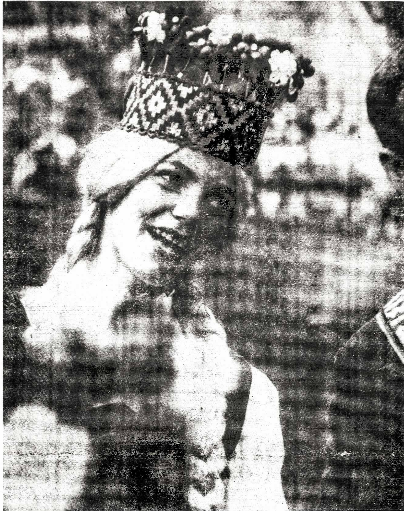
Okupuotos Lietuvos lietuvaitė, tautinių šokių šokėja, bando šypsotis po gerai pavykusio pasirodymo

Federacinio parlamento papildomai triju atstovu rinkimai buvo praversti Kvebeke ir Manotobėje (Nukelta į 6-tą psl.)