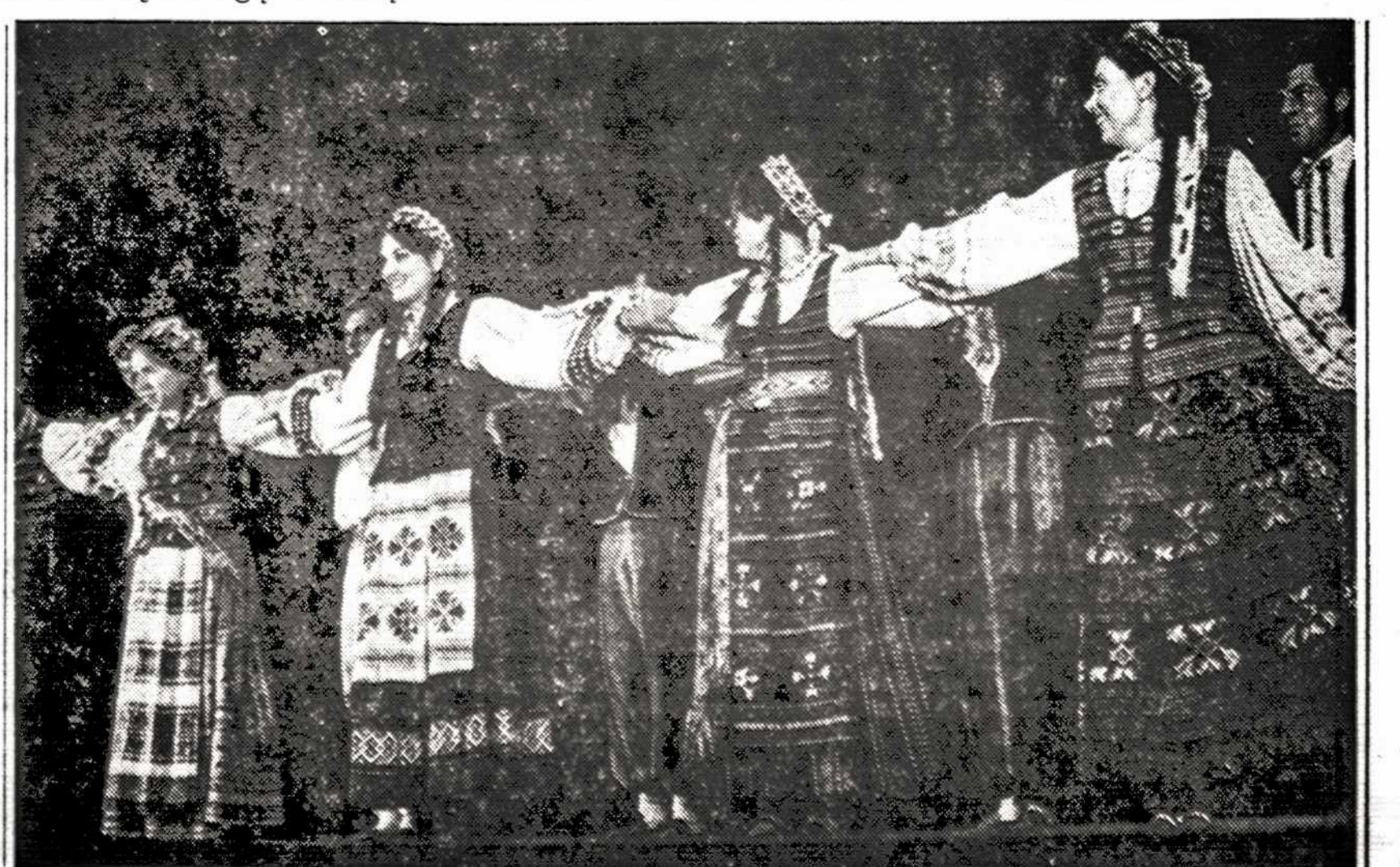
Čikagos "Grandies" šokėjos spektaklio metu. Ši grupė, turinti 45 narius, atliks programą, Toronte lapkričio 29 d. sporto klubo "Aušros" ir radijo programos "Tėvynės prisiminimų" rengiamame spektaklyje