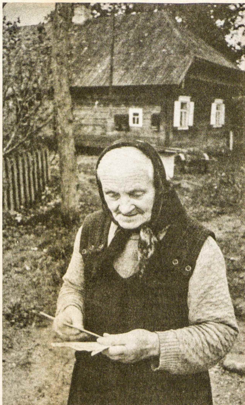
Sovietų okupuotoje Lietuvoje tautietė džiaugiasi laišku, gautu iš Vakarų nuo savo giminių. Nuotrauka — iš ALGIMANTO KEZIO knygos "Lithuania Through the Wall", išleistas Čikagoje. Ten angliškai parašyta: "Kadaise mes priklausėm vienai šeimai. Dabar esame svetimi — 'mes' ir 'jie'. Pasišveikinę žodeliu 'alio', sakome sudiev galbūt ant visados".

Čia tenka pabrėžti, kad visi laisvės kovotojai buvo savanoriai, bet toji mažuma lietuvių, kurie kovojo prieš savanorius, didžiąja dalimi buvo okupanto prievarta paimti savųjų žudyti. Ir kas žino, kiek rusiškai sovietiniai šovininiai džiaugėsi, jog dalį tautžudiško darbo