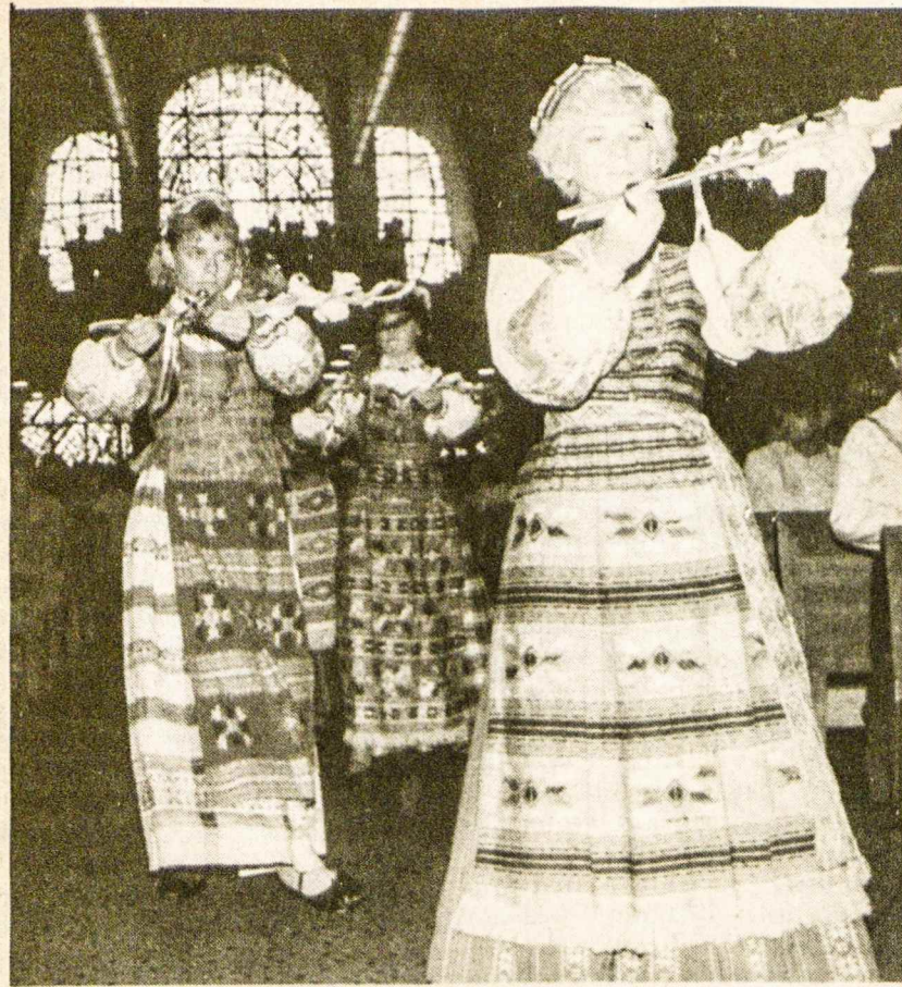
Sukaktuvinio ateitininkų kongreso pamaldose Čikagoje 1985. IX. 1 lietuviškosios Marijos procesija su maldingais išraiškios judesiais, giedant giesmę „Nenuženk nuo akmens, o Marija“