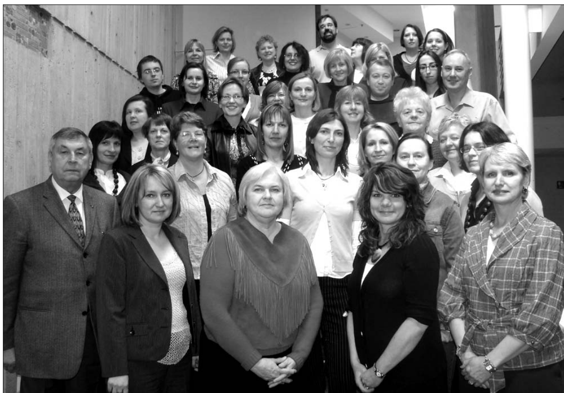
Kanados lietuvių mokytojų suvažiavimo, įvykusio š.m. balandžio 18 d. Prisikėlimo parapijos patalpose, dalyviai