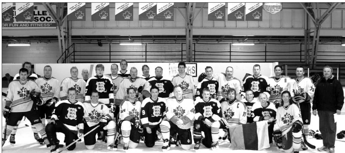
Toronto lietuvių ledo ritulio komanda "Klevo lapai" su savo varžovais

Toronto estai laimėjo "2009 Baltic Cup" ledo ritulio baigmės varžybas prieš Toronto latvius 3-1 "Central Arena", balandžio 17 d. Rungtynes stebėjo daugiau kaip 200 žiūrovų. Kiti "playoff" rezultatai šiemet buvo: "Klevo lapai" 2 – estai 5, "Klevo lapai" 5 – latviai 10 ir estai 2 – latviai 2. Nuotraukos ir detalės – tinklalapyje http://balticcup.blogspot.com . AK