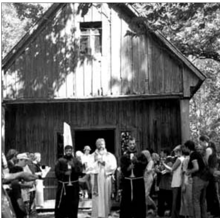
Šeimų stovykla Pakutuvėnuose 2008 m.

Ji atėjo po ilgų savaitių buvimo čia, po daugelio bendrų vakarienių ir bendrų maldų, po susikaupimo savyje ar dirbant pačius juodžiausius mūsų kuklios buities darbus. Nežinau dienos, kada tai įvyko, tik pajutau, kad mano skausmą kažkas pasidalijo su manimi.