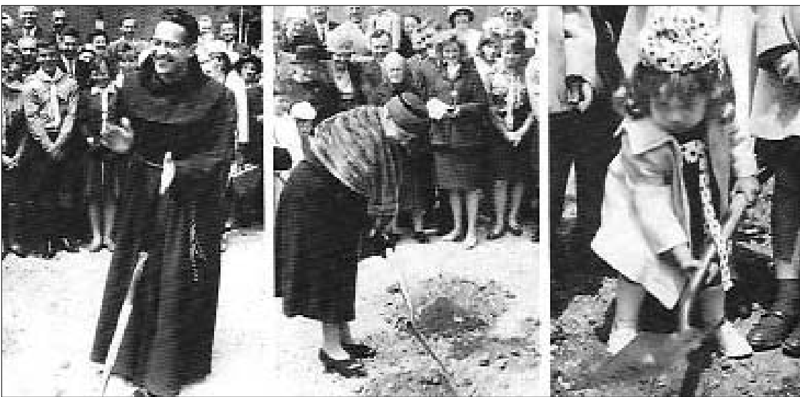
Istorinėje nuotraukoje – pradžių pradžia. Kasama žemė pirmosios Prisikėlimo šventovės pamatams College gatvėje, Toronte