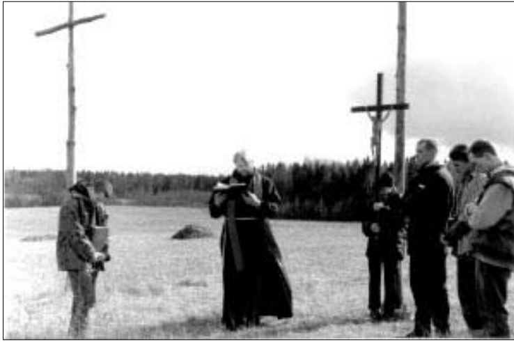
Šv. Antano Paduviečio šventovės tikintieji savo rankomis pastatė Kryžiaus kelią