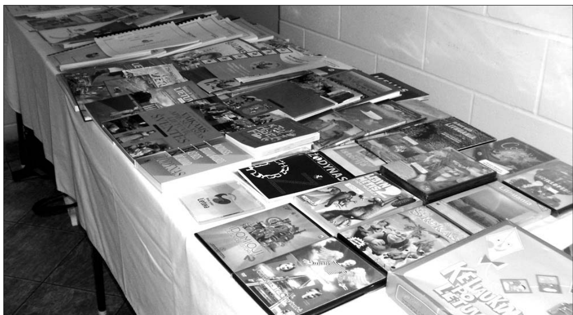
Knygų stalas Kanados lietuvių mokytojų suvažiavime š.m. balandžio 18 d. Toronto Prisikėlimo parapijos patalpose