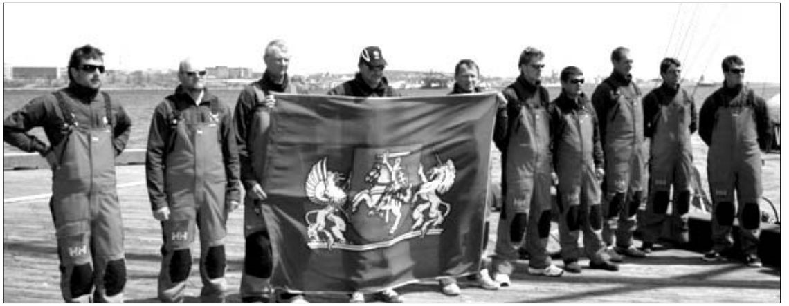
Halifakse "Ambersail" 8 įgula su prezidento vėliava

Š.m. balandžio 26 dieną Tūkstantmečio odisėjos jachta "Ambersail" pasiekė tolimosios Kanados krantus Nova Škotijos provincijoje, kur Halifakso uostamiesčio pagrindinėje aikštėje skambant dūdmaišio melodijoms būriuotojų laukė didelis būrys pasitinkančiųjų su Lietuvos vėliavytėmis.