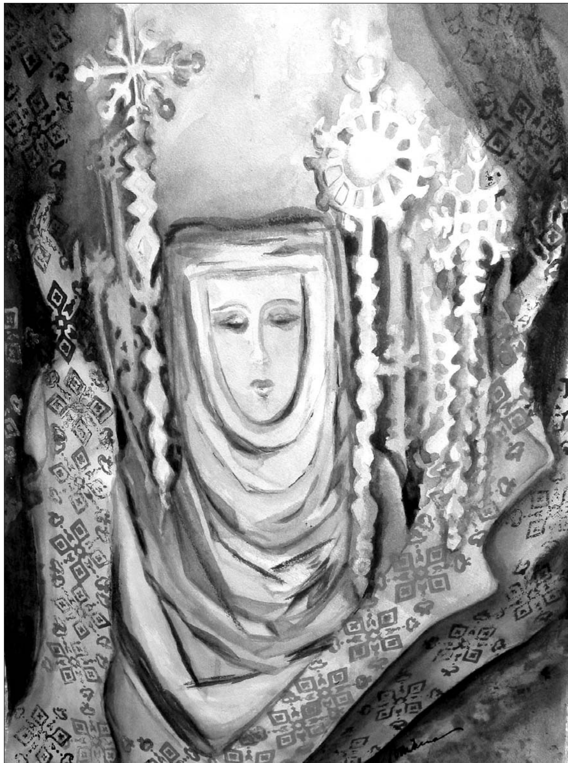
TRADICIJOS IŠLAIKYMAS (akvarelė)