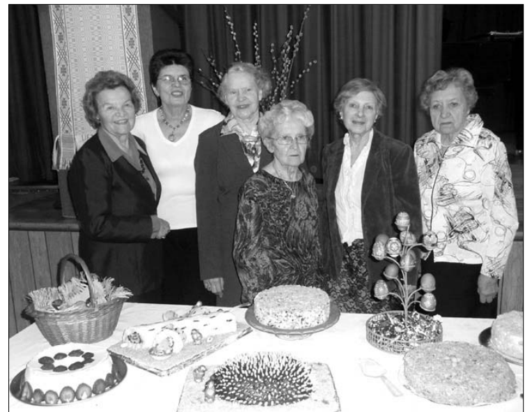
KLKM dr-jos Montrealio skyriaus valdyba prie Velykų stalo š.m. balandžio 19 d. Aušros Vartų parapijos salėje

Antroji: "ALF suvažiavimas pageidauja, kad Amerikos lietuvių fondo stipendijos būtų, kur galima, skiriamos studentams, kurie atlieka nusta-tyto laiko darbo stažuotes