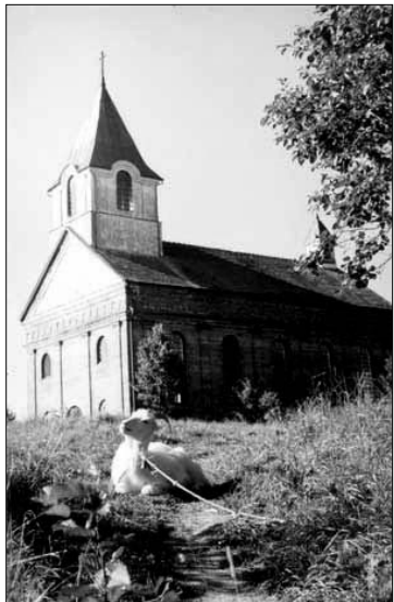
Šv. Antano Paduviečio šventovė Pakutuvėnuose, Plungės raj.

Aštuoni šimtai metų skiria mus nuo istorinio šv. Pranciškaus gimimo ir veiklos dešimtmečių, tačiau laiko išbandymą atlaikę pagrindiniai jo siekiai – gerumu ir atjauta pa-