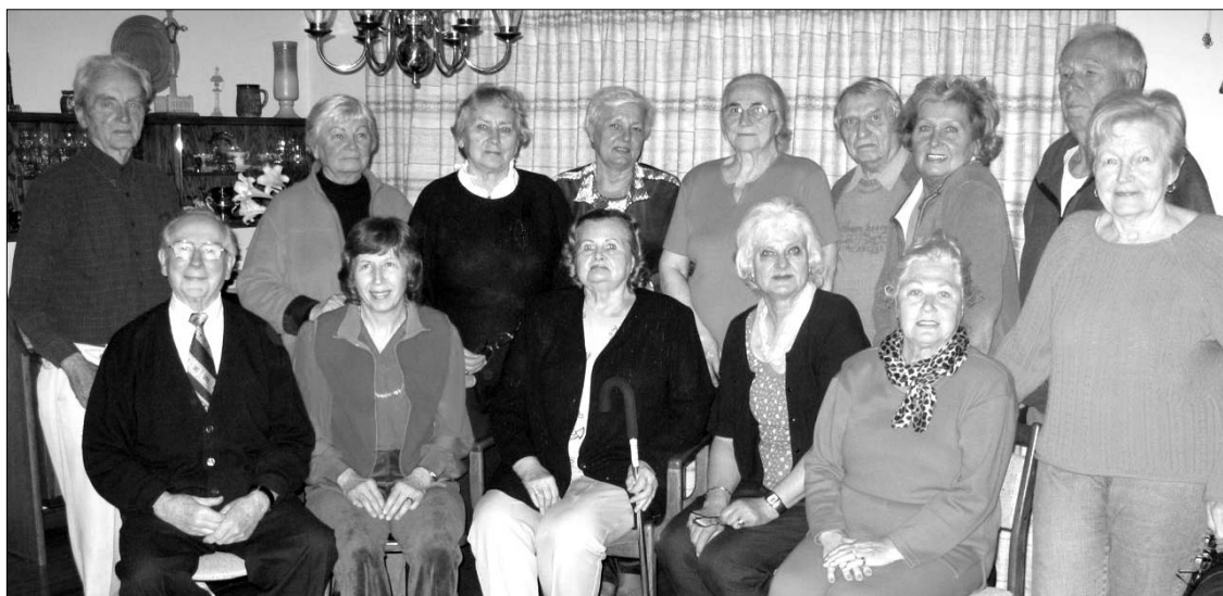
Londono, ON, "Pašvaistė", besiruošianti dalyvauti IX-ojoje išeivijos Dainų šventėje "Daina aš gyvenu"