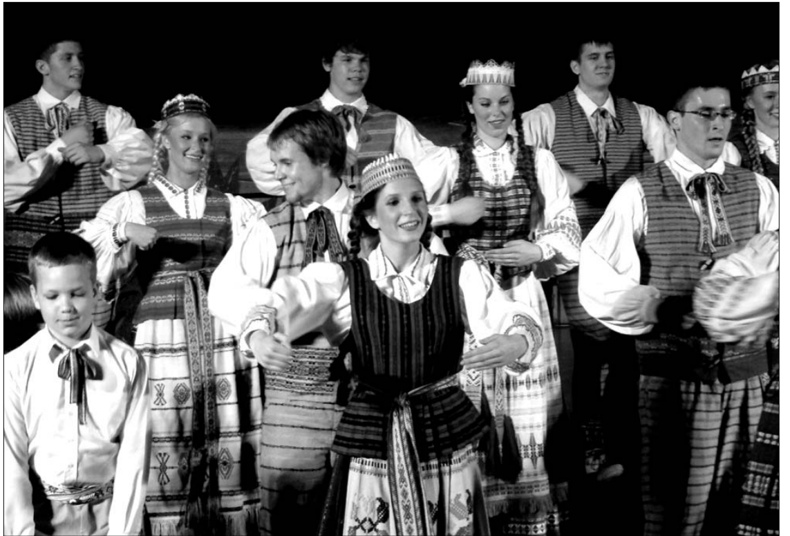
Akimirka iš Toronto lietuvių jaunimo ansamblio "Gintaras" koncerto "Suk, suk ratelį", įvykusio š.m. balandžio 26 d. Anapilio salėje, Mississaugoje, ON