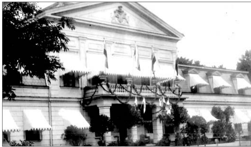
Žagarės dvaro rūmai (kairėje) apie 1914 m. ir arklininko namas (1982 m.)

Bandymų įtraukti dvarų paveldą į tautinį lietuvių kultūros lobyną buvo ir yra, bet įdomu tai, kad kol kas dar nesusiformavo požiūris, koks buvo Lietuvos valstybės dvarų ir juose gyvenusių žmonių (kunigaikščių, feodalų, žynių, vyskupų, karo vadų, dvarininkų, izdo tvarkytojų ir kt.) vaidmuo plėtojant tautos kultūrą ir kuriant politiką.