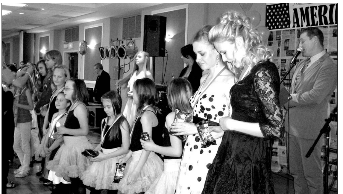
Dalis konkurso dalyvių, kurie pasirodė Amerikos lietuvių jubiliejinėje šventėje