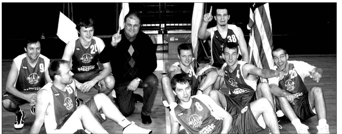
"A" lygio varžybose be konkurencijos pasirodė ir ambasados taurę iškovojo Niujorko LAK "Vilkų" komanda