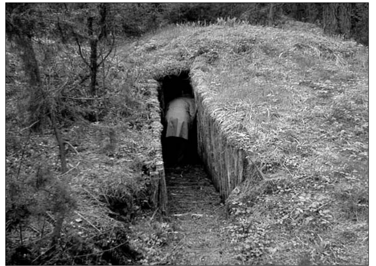
Prie atstatyto bunkerio Kalvių girioje