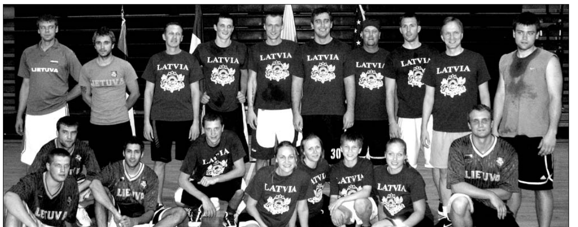
"B" varžybų baigmėje susitiko Latvijos "Ambasados" komanda ir Baltimorės "Vilkas"