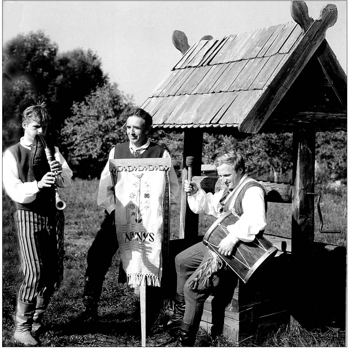
Žemaitijos muzikantų grupė “Apnys” prieš koncertą bando naujuosius savo instrumentus

Vartotojas – tarp kūjo ir priekalo? – 11 psl.