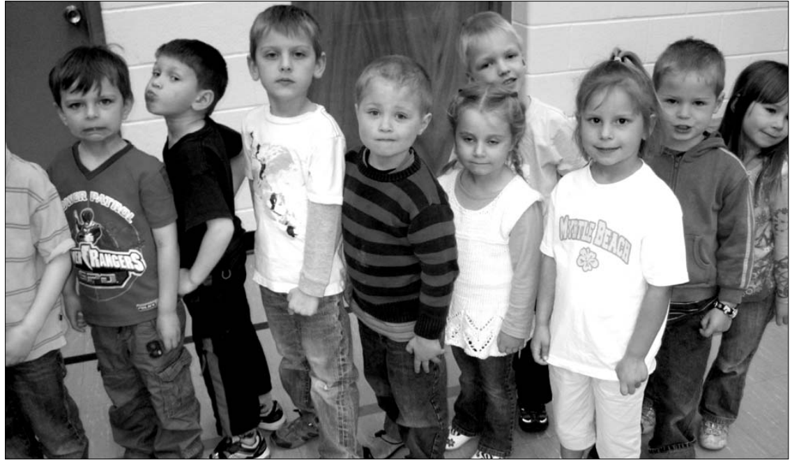
Maironio mokyklos darželinukai šventę Motinos dieną