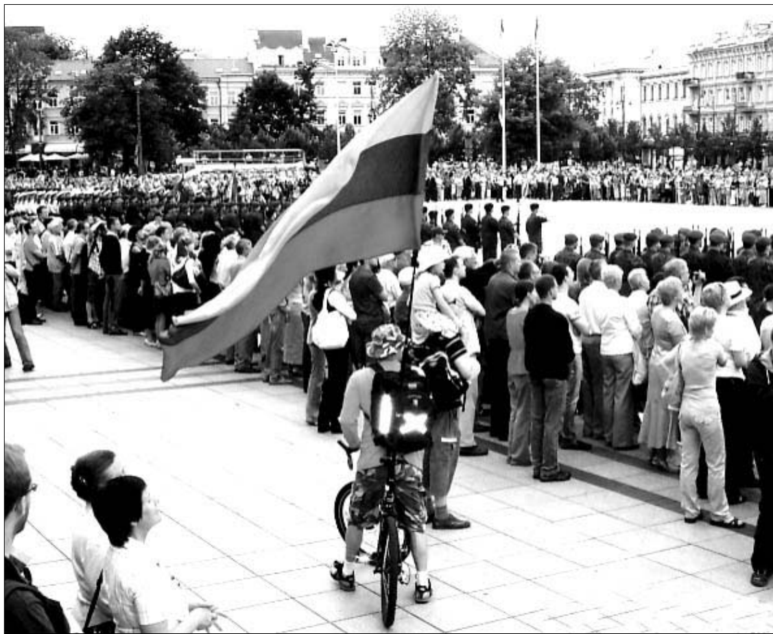
Lietuvos nepriklausomybės 20-mečio iškilmėse žiūrovai stebi kariuomenės parodą Vilniaus katedros aikštėje