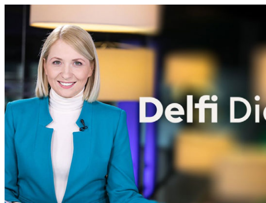
Lithuanian TV online