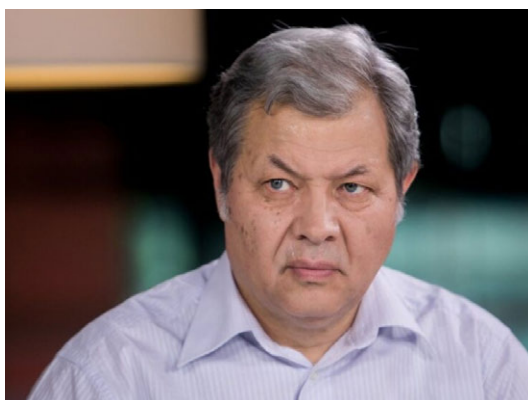
New director at Genocide Centre